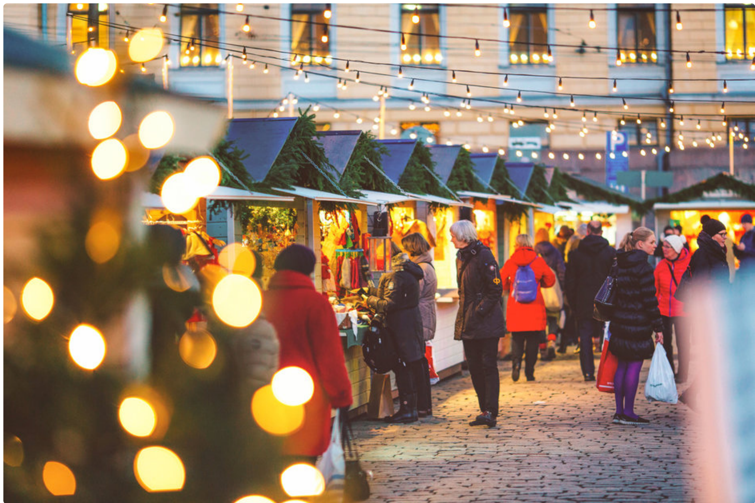
Joulumarkkinat, kuva: Jussi Hellsten.