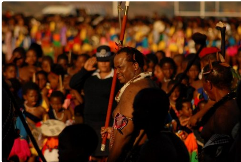
Swazimaan kuningas Mswati III saapunut katsastamaan Umhlanga-seremonian neitsyitä.

Historia: Aiemmin Iso-Britannian protektoraatti. Itsenäistyi 1968, jolloin maan hallitsijana oli kuningas Sobhuza II. Nykyinen kuningas Mswati III on hallinnut maata vuodesta 1986.