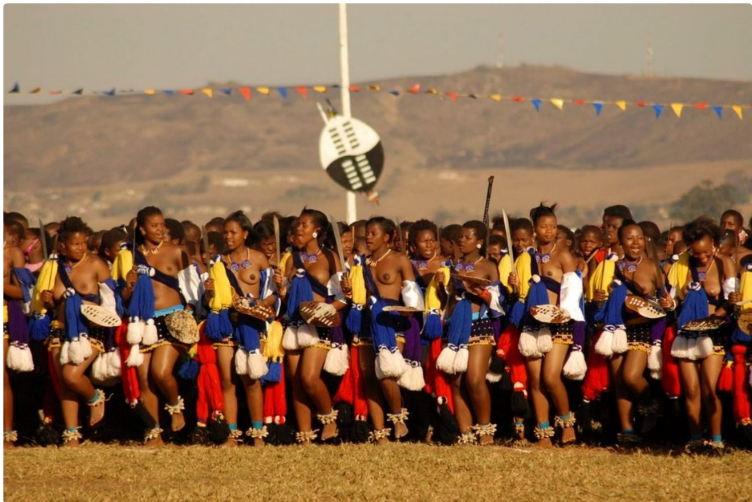
Umhlanga eli Reed Dance on perinteinen nuorten tyttöjen riitti Swazimaassa.