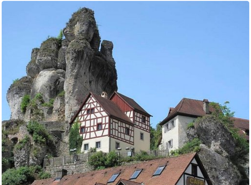
Ja Sveitsi Monacon ohella kuuluu maailman kalleimpiin lomamaihin.