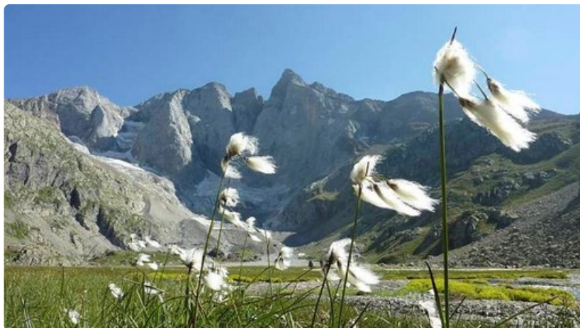
Macizo del Vignemale vuorten pohjoispuoli Oulletes de Gauven vuoristotuista kuvattuna (42°47'31.77" N 0°08'27.31" W).