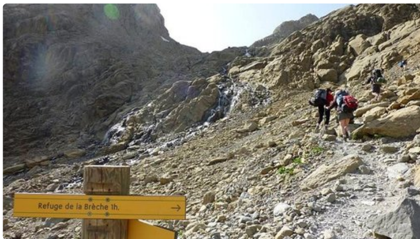
Vaeltajia tunnin matkan päässä La Brèchen vuoristotuista.

Varustesuositukset La Ruta de los Perdidos -reitille