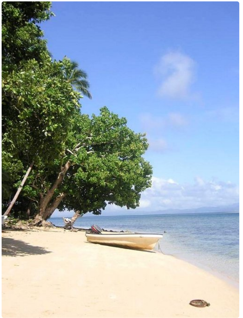
Tyynenmeren saarista Fidži tarjoaa häälomalaisille tekemistä. Erityisesti merenalainen maailma on ensiluokkaista.