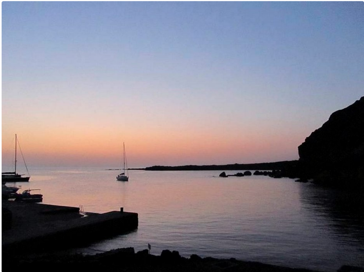
Linosan satama on paras paikka katsella Välimeren auringonlaskua.