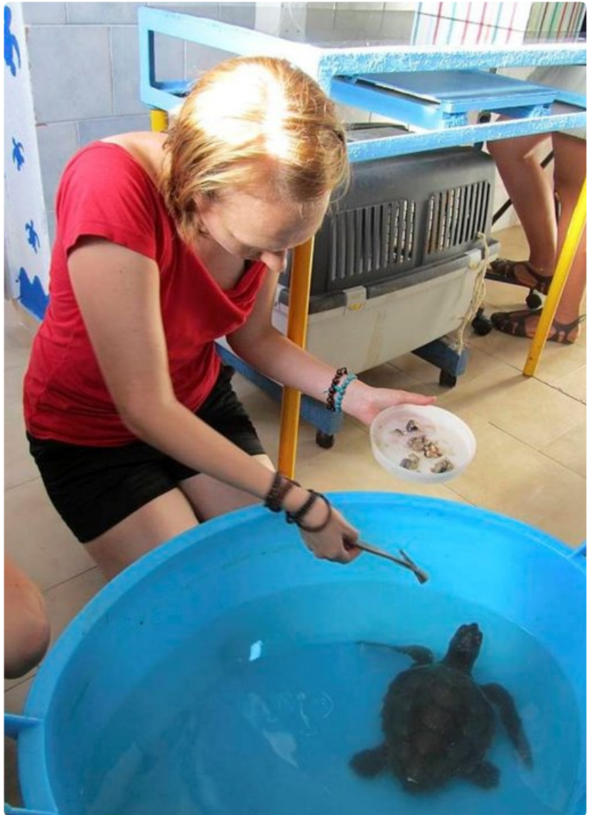
Vapaaehtoiset pääsevät ruokkimaan loukkaantuneita kilpikonnia kerran päivässä sardiineilla.