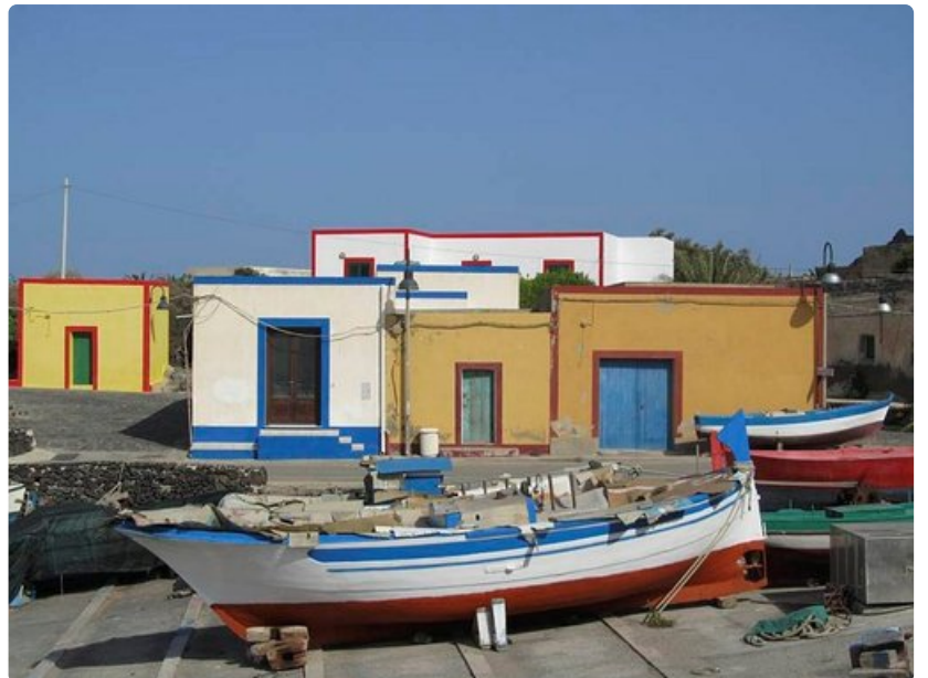
Linosan arkkitehtuuri ei juurikaan muistuta muuta Etelä-Italiaa. Talot ovat hyvin värikkäitä ja ne yleensä saavat uuden maalikerroksen joka vuosi.