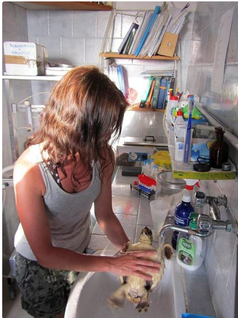
Ruokinnan jälkeen kilpikonnat huuhtaistaan nopeasti juoksevan veden alla. Pienet raajat sätkivät voimakkaasti.