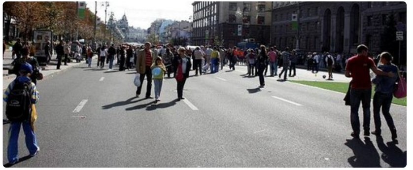
Pääkatu Kreshatykin iloista viikonlopputunnelmaa.