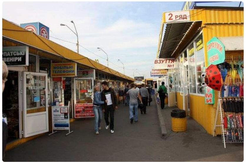
Kioskeista Petrivkan metroaseman vieressä löytää kaikkea alusvaatteista kännyköihin.

Monia Ukrainaan matkavia varoitellaan tönkeystä asiakaspalvelusta, eikä varoitus ole täysin tuulesta temmattu. Matkailija saattaa hämmästyä kännykkäänsä keskittyneestä myyjästä tai ruokakaupan kassojen tavasta olla tervehtimättä asiakasta. Myöskään kaikissa ravintoloissa ei aina tule sellainen olo, että tarjoilija on töissä asiakasta varten. Vaikka Kiova voi vaikuttaa tavalliselta länsimaiselta kaupungilta, siitä huokuu vahvasti slaavilainen varautuneisuus, melankolia ja kamppailu jokapäiväisen leivän eteen. Tätä tunnelmaa voi etsiä vaikkapa laitakaupungin metroasemilta.