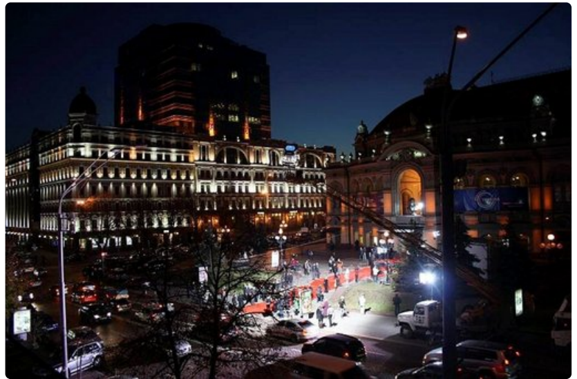
Kansallisooppera ja naapuritalo iltavalaistuksessa.