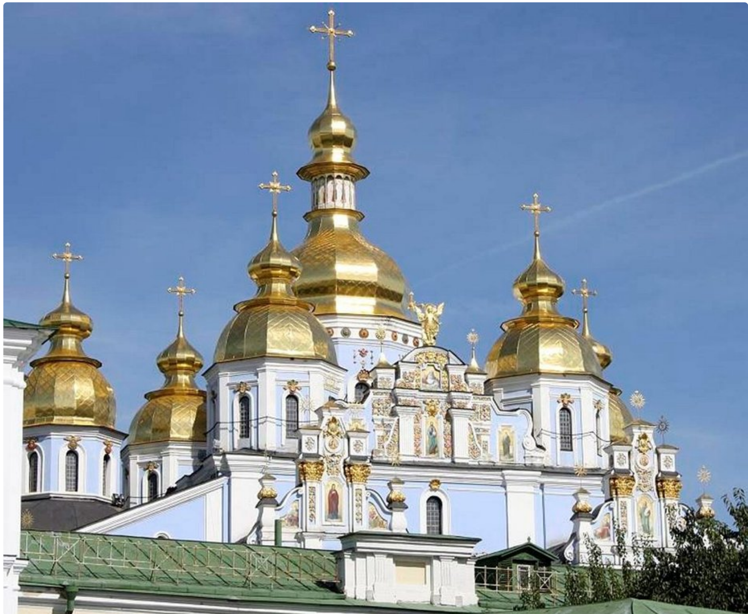
Mikaelin katedraali Kiovan keskustassa.