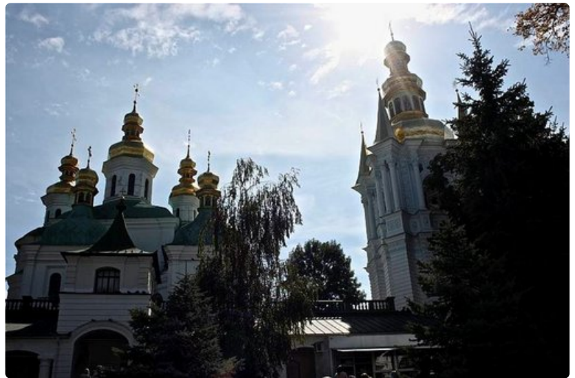
Kirkkoja Pecherska Lavran alueella.