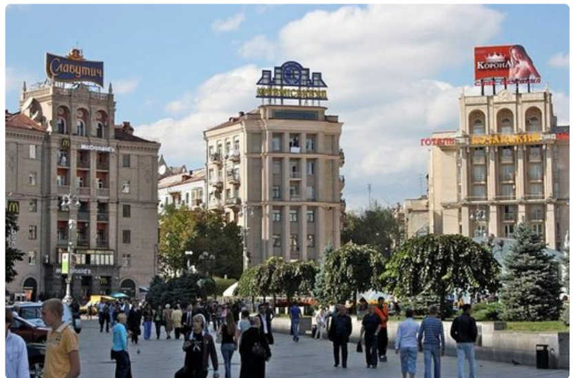
Keskustan Itsenäisydenaukiota ympäröivää rakennustyyliä.