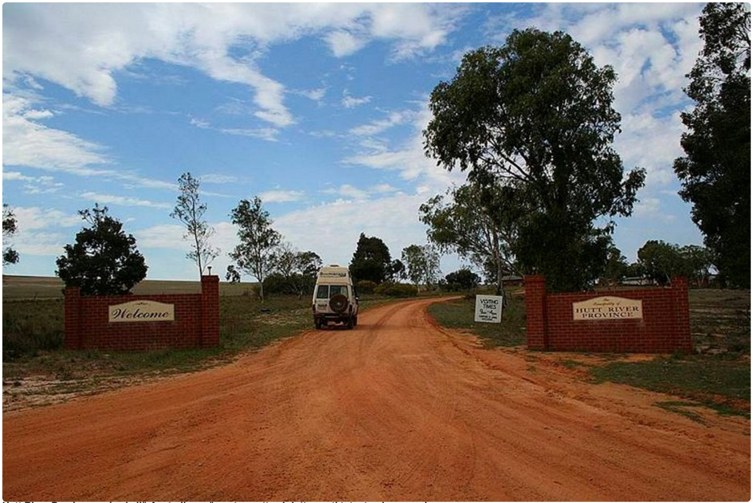
Hutt River Province on keskellä Australian erämaata, mutta ehdottomasti tutustumisen arvoinen.