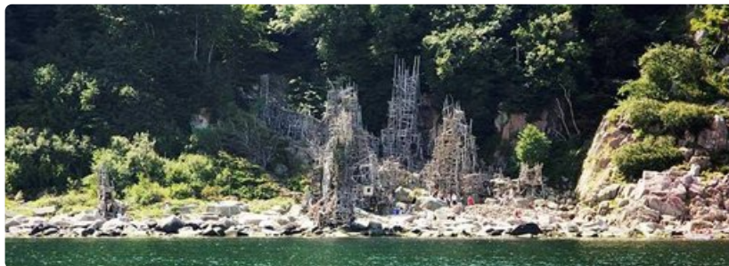
Ladonian rantaviivaa. Ruotsin valtio määräsi kyseisen kyhäelmän purettavaksi.