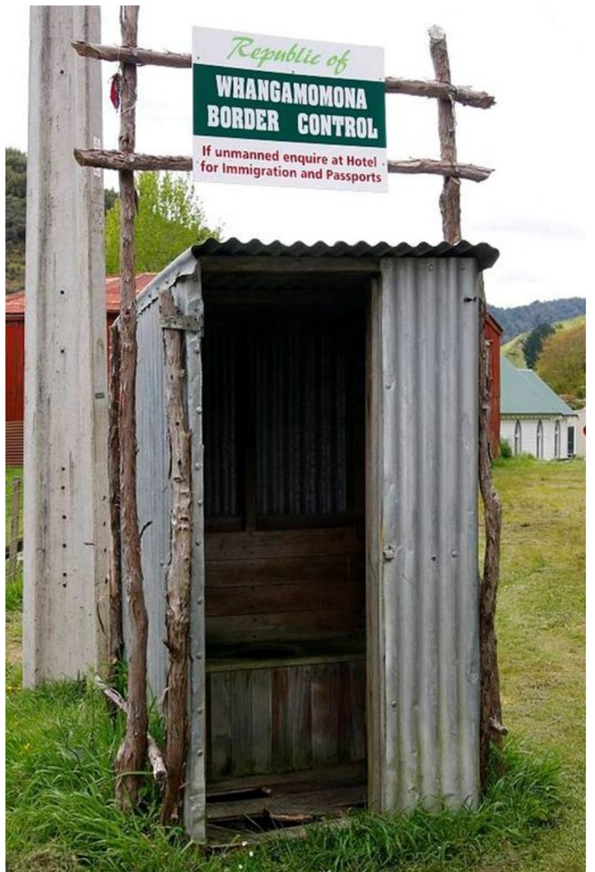
Whangamomonan rajanylitys onnistuu myös ilman passia.