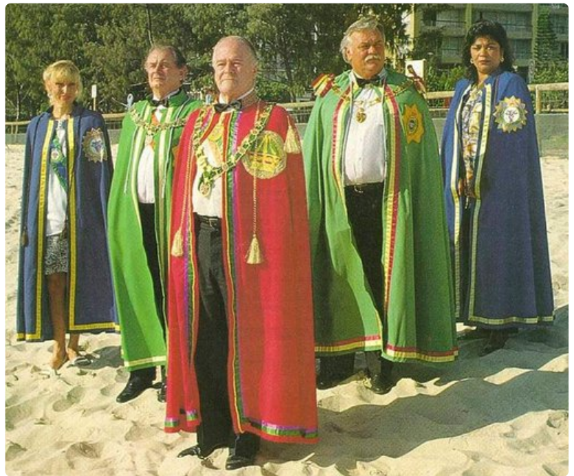
Hutt River Provincen kuninkaalliset itsenäisyyspäivää juhlistamassa.

Pohjoissaaren lounaiskolkassa "hävinneellä maantiellä" sijaitsevaan kylään saapuva on ällikällä lyöty. Rajaa lähestyttäessä näkyy tienviitta sekä tasavaltaan saapumisesta että Uudesta-Seelannista poistumisesta. Raja-asemakin on pystytetty kylän reunalle, mutta