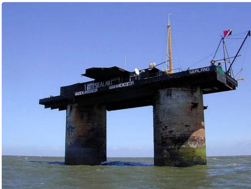
Sealandin valtio kaikessa jylhydessään.