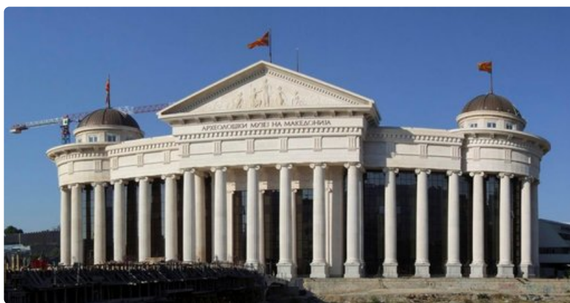
Vierailun arvoinen arkeologinen museo Skopjessa.