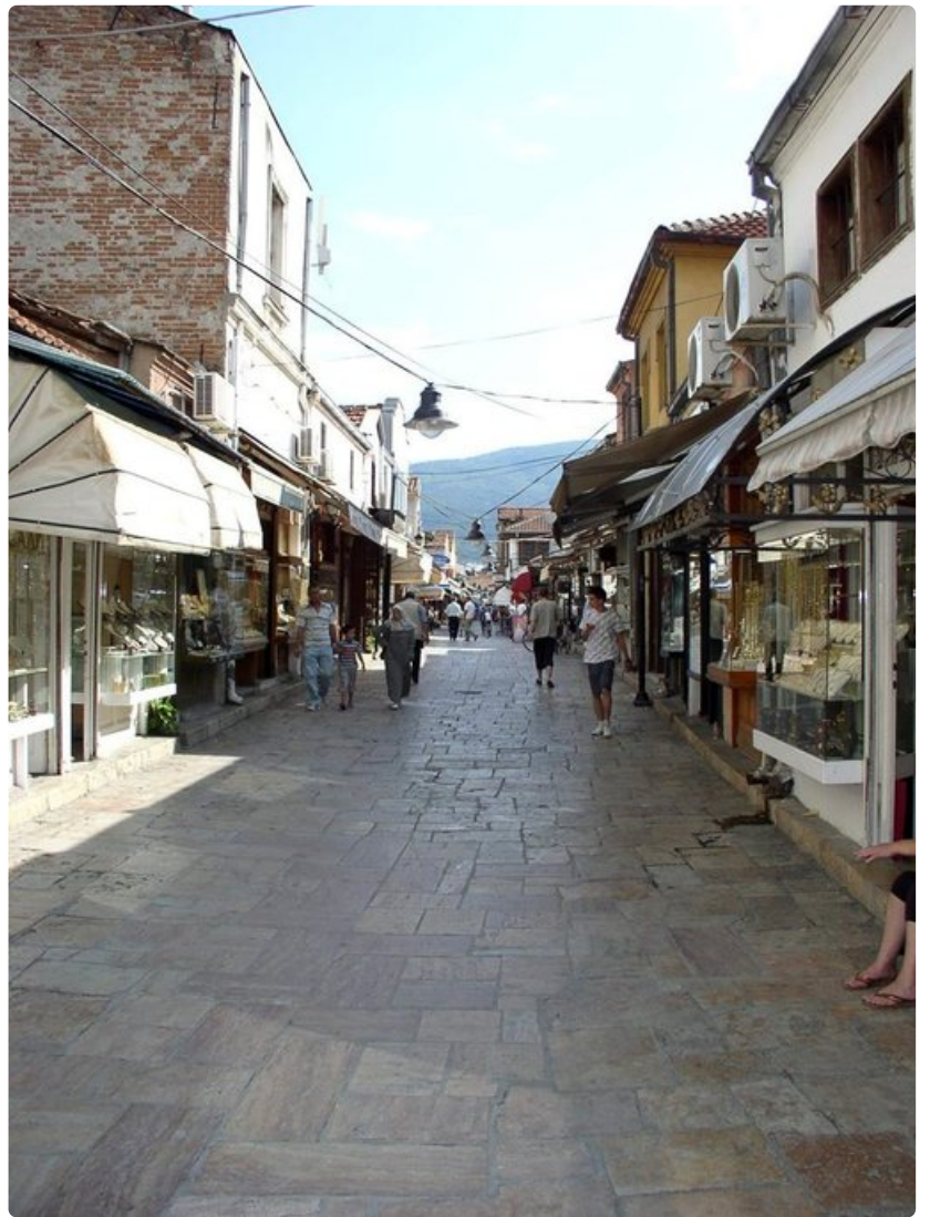
Skopjen basaari on sekoitus käsityöläiskauppoja ja ravintoloita.