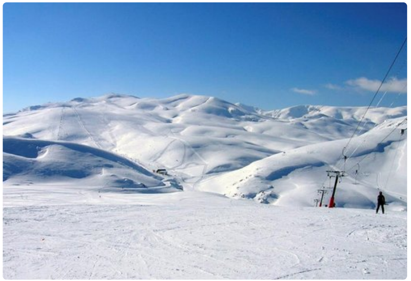
Mavrovo on varteenotettava laskettelukeskus Euroopassa.

o Heraclea. Matka Heracleaan on kuin olisi yhtäkkiä saapunut keskelle Rooman antiikin valtakuntaa. Se on Makedonian imperiumin suurin jäljellä oleva alue, jonka kivipylväät ja rakennusten seinämät kertovat paljon ajankuvasta. Monet erityispiirteistä ovat yllättävän hyvin säilyneet ja paljon on myös restauroitu. Erityisesti valtavat mosaiikkilattiat ovat jo pelkästään matkan arvoiset. Alueella on lisäksi amfiteatteri sekä pieni museo.