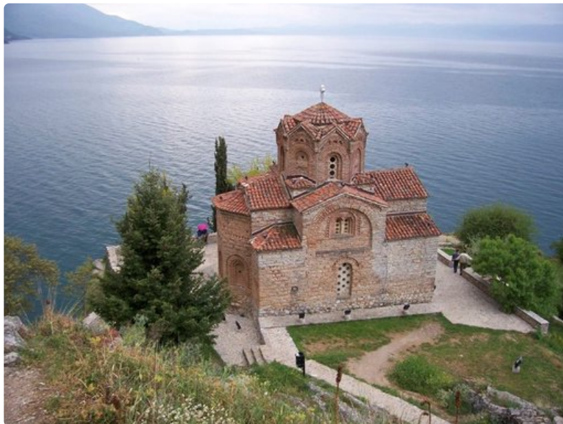
Jovan Kaneo on yksi Makedonian upeista uskonnollisista nähtävyyksistä.