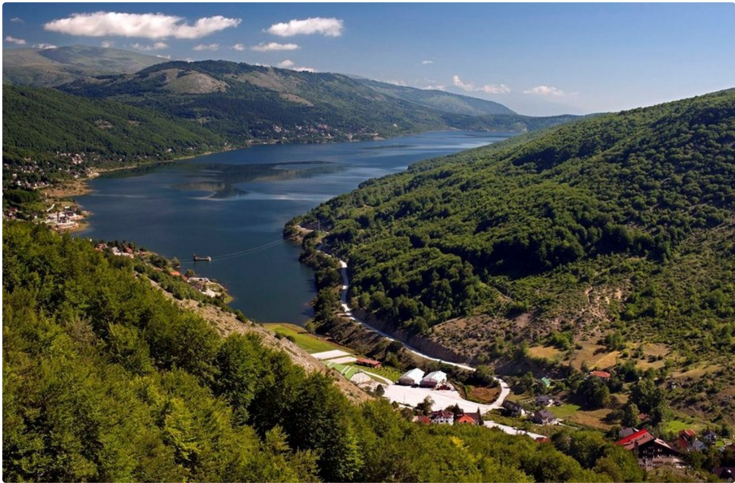
Mavrovossa näkymät puhuvat puolestaan.