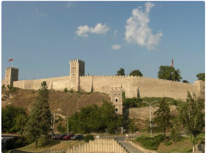
Skopjen Kalen linnoitus on yksi sen merkittävimmistä tunnusmerkeistä