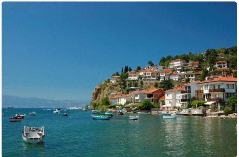
Ohrid on tunnelmallinen rantakohde.