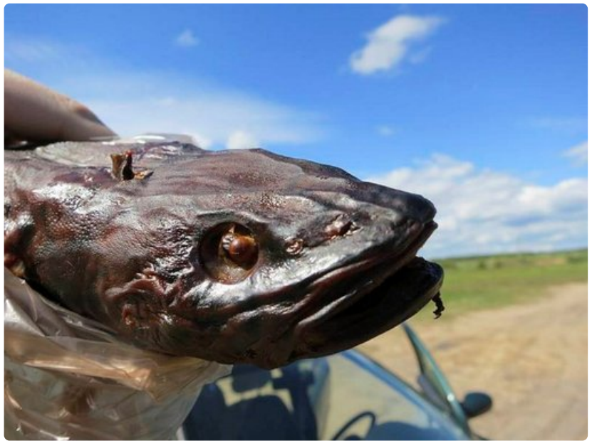
Peipsi-järven rannalla kannattaa maistaa savukalaa, jota voi ostaa tien varren kojusta.