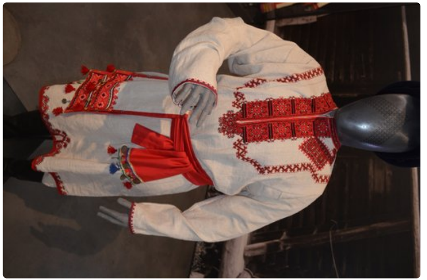
Suomalais-ugrilaisen kulttuurin näyttely pukuineen on laajempi kuin missään.