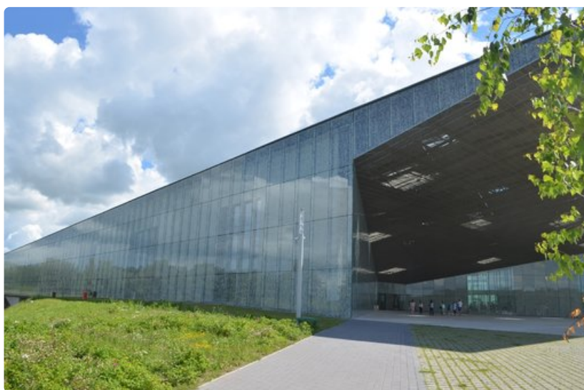
Museon sisäänkäynti on vaikuttava.