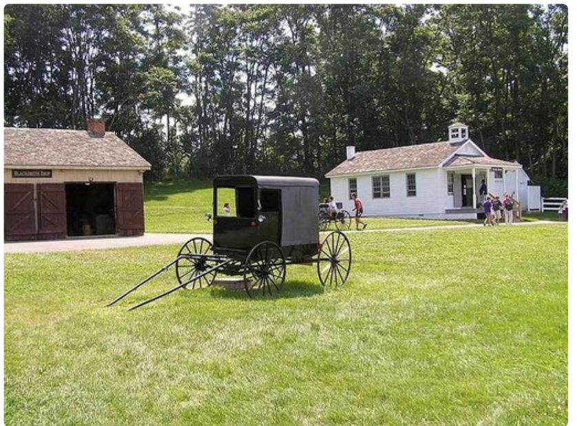
Perinteinen sepän paja, katetut rattaat sekä askeettinen koulu.