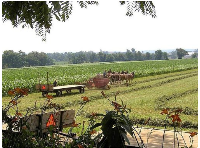
Pellolle ei mennä moottorikäyttöisellä leikkuupuimurilla.

Mukanaan he toivat paitsi uskontonsa myös kielensä. Tänäkin päivänä heidän keskuudessaan puhutaan arkikielenä englantia sekä niin sanottua Pennsylvanian saksaa, joka perustuu vanhaan Sveitsissä puhuttuun germaaniseen kieleen.