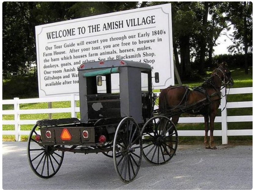
Kevyet rattaat on tarkoitettu tavarankuljetukseen.

Jos tapahtuu vahinko; lato voi palaa, rattaat tai saha särkyä, ei hätää, sillä asia laitetaan kuntoon yhteisvoimin. Jokainen kantaa