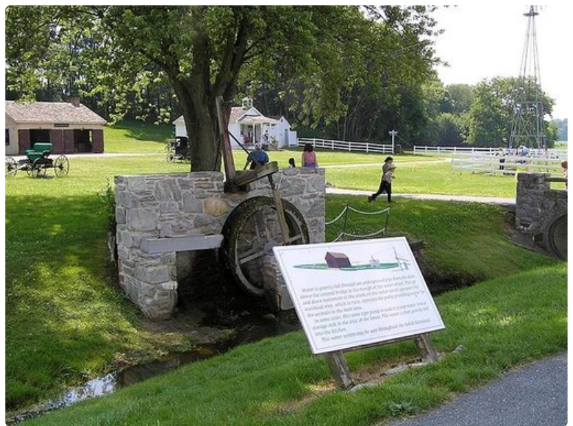
Vesi antaa voimaa. Monimutkainen vipulaitteisto voi käyttää vaikkapa pesukonetta tai sahaa.