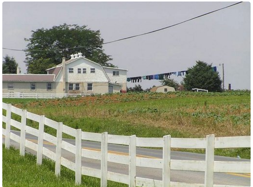
Amissien pyykkipäivä. Kekseliällä pyörämekanismilla saadaan naru täyteen suhteellisen helposti.