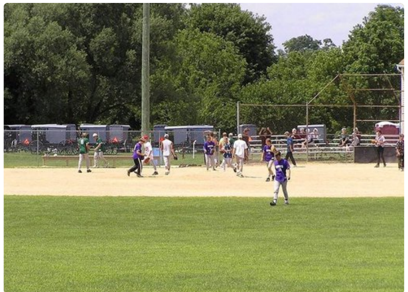
Baseball-ottelu mennoniitit vastaan amissit. Jälkimmäisiä ei vielä näy, mutta ajopelit ovat jo parkissa. Huomaa tyttöjen joukko aidalla.