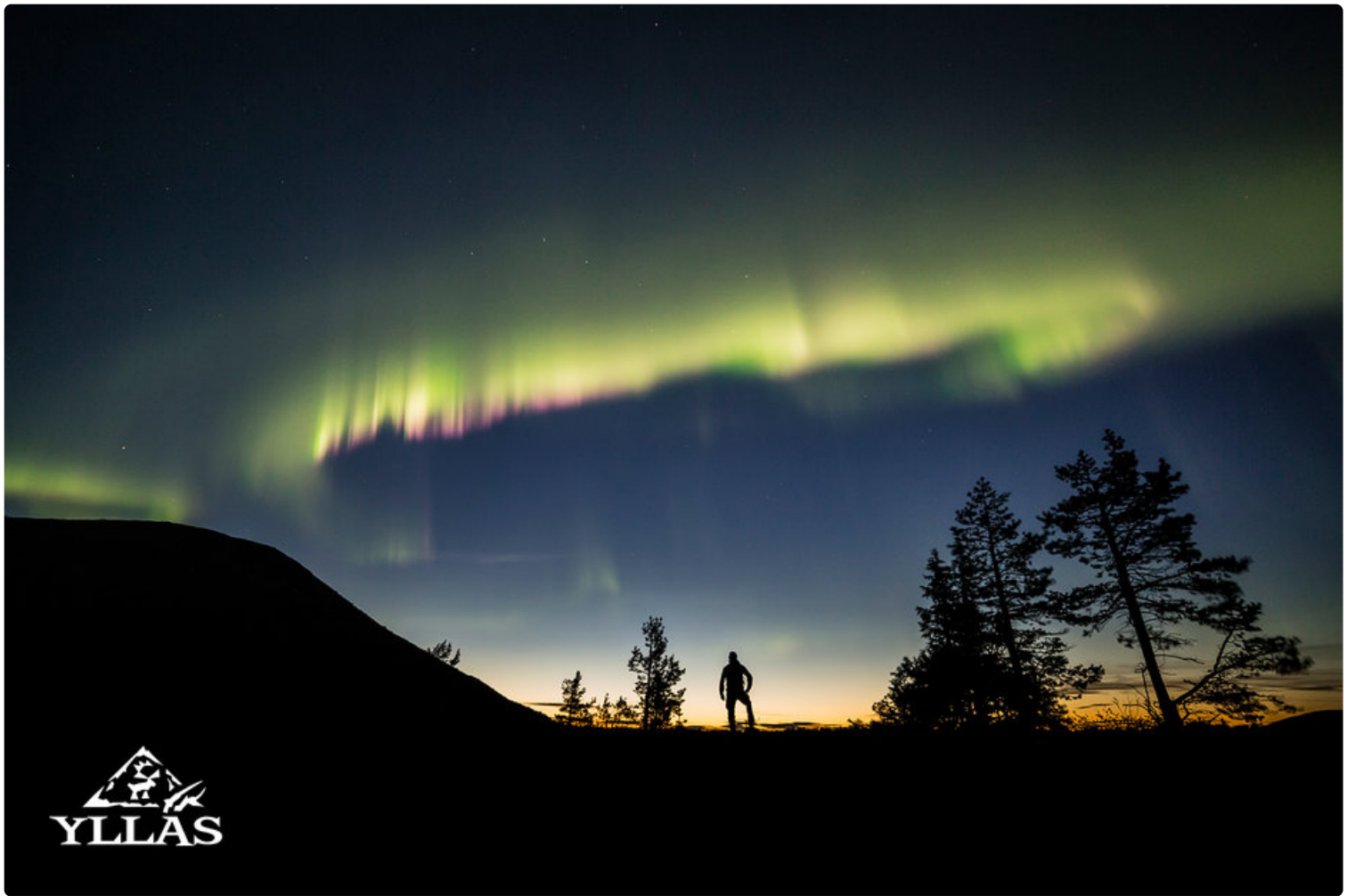
Revontulet Ylläksen yllä.