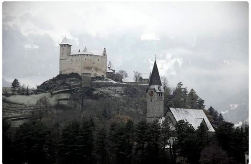
Vaduz on Liechtensteinin ruhtinaskunnan pääkaupunki.