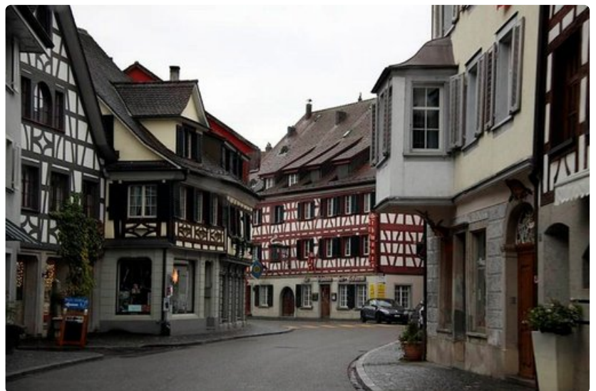
Bodenjärven rannalla kulkeva tie numero 13 vie useiden idyllisten pikkukylien läpi.