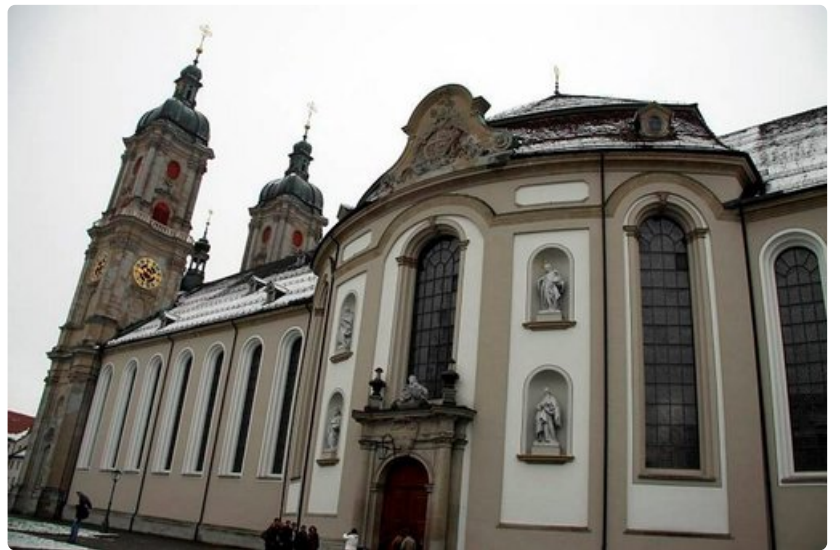
Abbey of Saint Gall on upea luostari, jonka arvokkaita käsikirjoituksia säilyttävä kirjasto on yksi maailman vanhimmista.