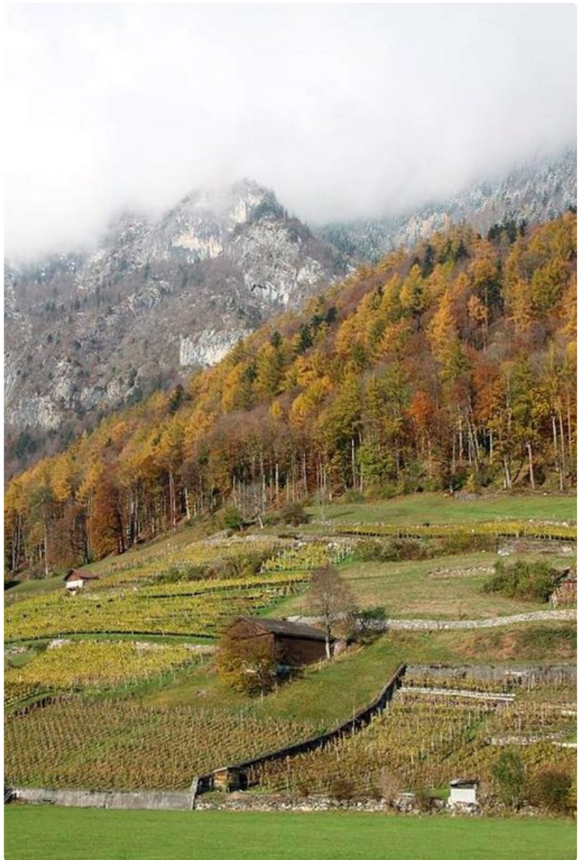
Sveitsin rinteillä kasvava viini on raikasta ja arvostettua.