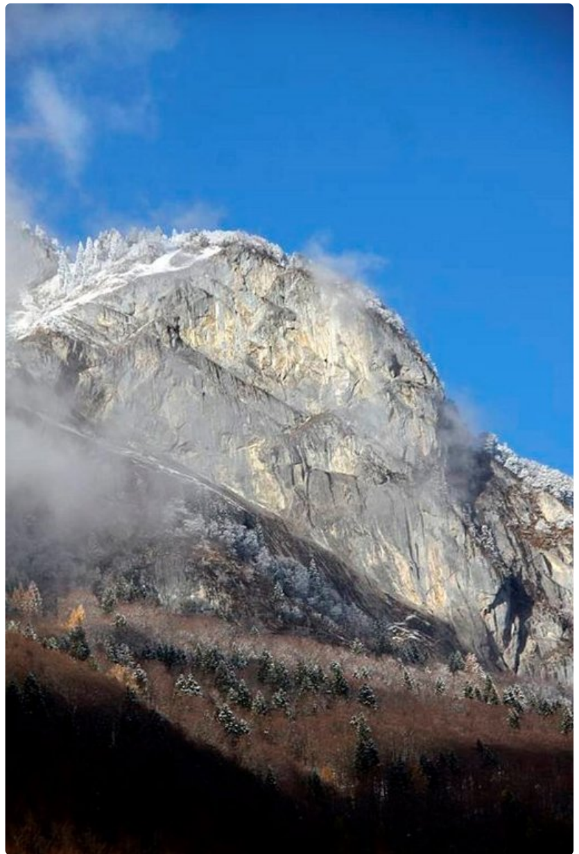
Sargans-vuoret ovat Unescon maailmanperintökohde.