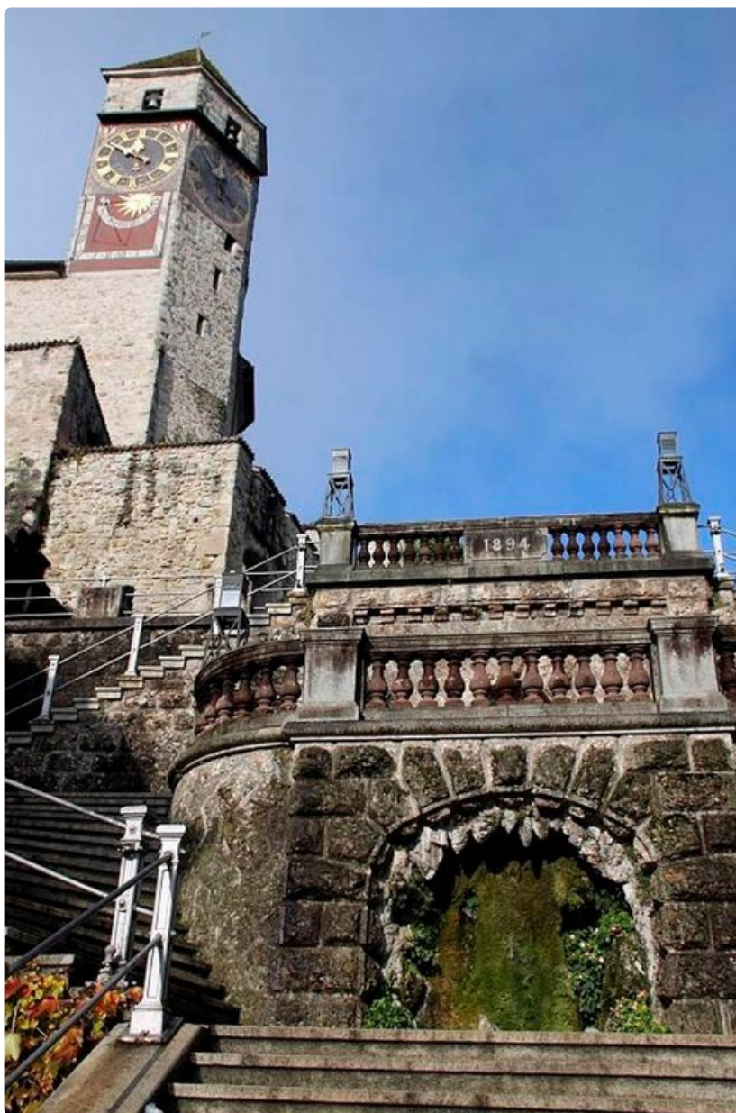
Sveitsin Rapperswill-Jonan kaupungissa Zürich-järven voi ylittää siltaa pitkin.