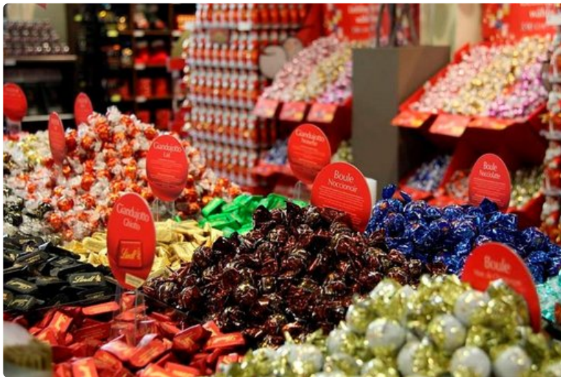
Lindt&Sprünglin suklaatehdas, Seestrasse 204, CH-8802 Kilchberg.

Lyhyt matka Liechtensteiniin taituu nopeasti hyväkuntoista tietä pitkin. Rajan ylitystä ei edes huomaa, mutta pian ohitetaan kyltti, joka toivottaa tervetulleeksi pieneen, vieraanvaraiseen valtioon. Navigaattori ohjaa yhä ylempään ja ylempään. Vihdoin saavutaan Park Hotel Sonnenhofin pihaan. Perhehotellin palvelu on ensiluokkaisen yksilöllistä, ja jos haluaa lomansa aikana panostaa yhteen hintavampaan hotelliin, kannattaa valita tämä. Huone on varustettu upealla vuorinäkölalalla, saunatila uima-altaineen on mitä romanttisinta ja Michelin-tähdin kruunattu ruoka erinomaista. Illallisen kanssa tarjoillaan sveitsiläistä viiniä, jota riittää viintiin vain vähän. Koska Sveitsin alueen raikkaita viinejä on vaikea saada, ovat ne hyvä tulaisasidea. Pääkaupungin nähtävyydet, kuten kansallismuseo ja taidegalleriat, on pian kierretty. Huolitellun Vaduzin voi kävellä helposti päästä päähän. Liechtensteinissa kannattaa tutustua myös vanhoihin linnoihin, joita on sekä pääkaupungissa, että sen liepeillä.