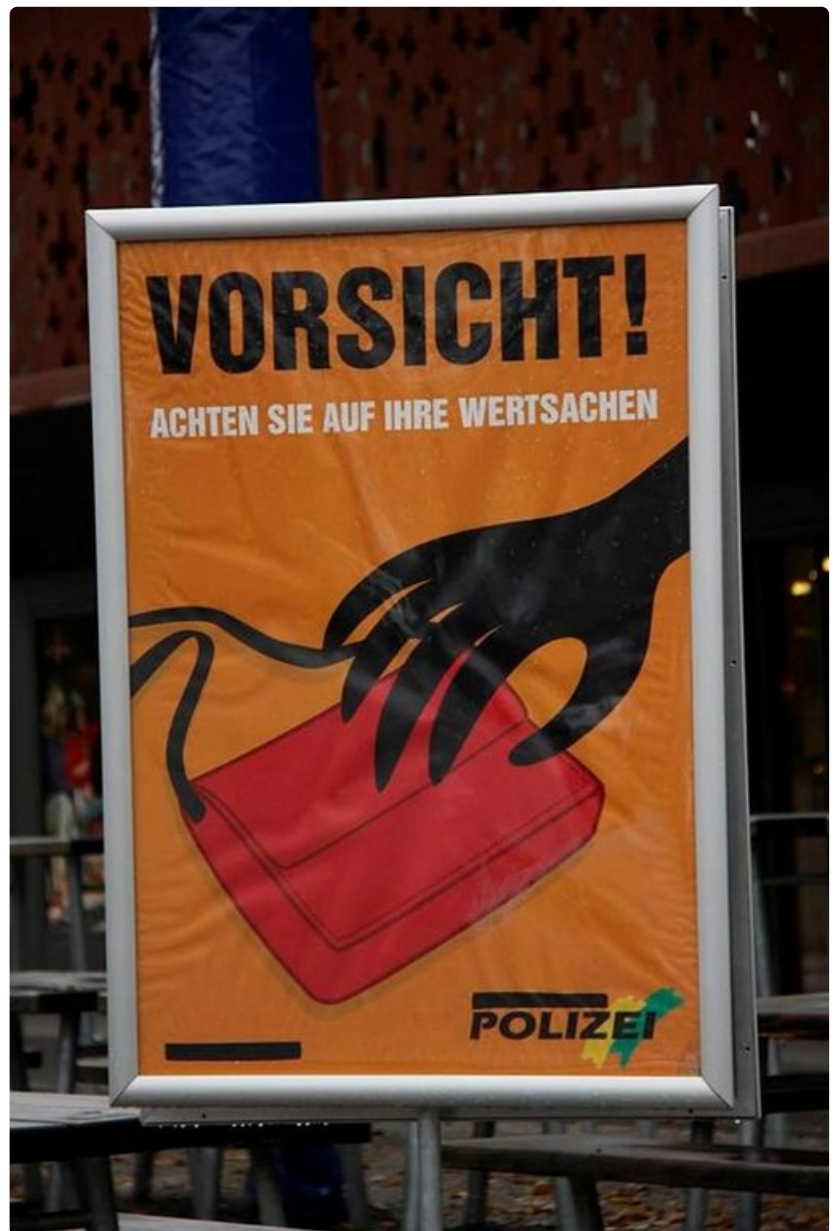
Zürichin kerrotaan olevan turvallinen kaupunki, mutta turistikohteissa on syytä varoa taskuvarkaita.