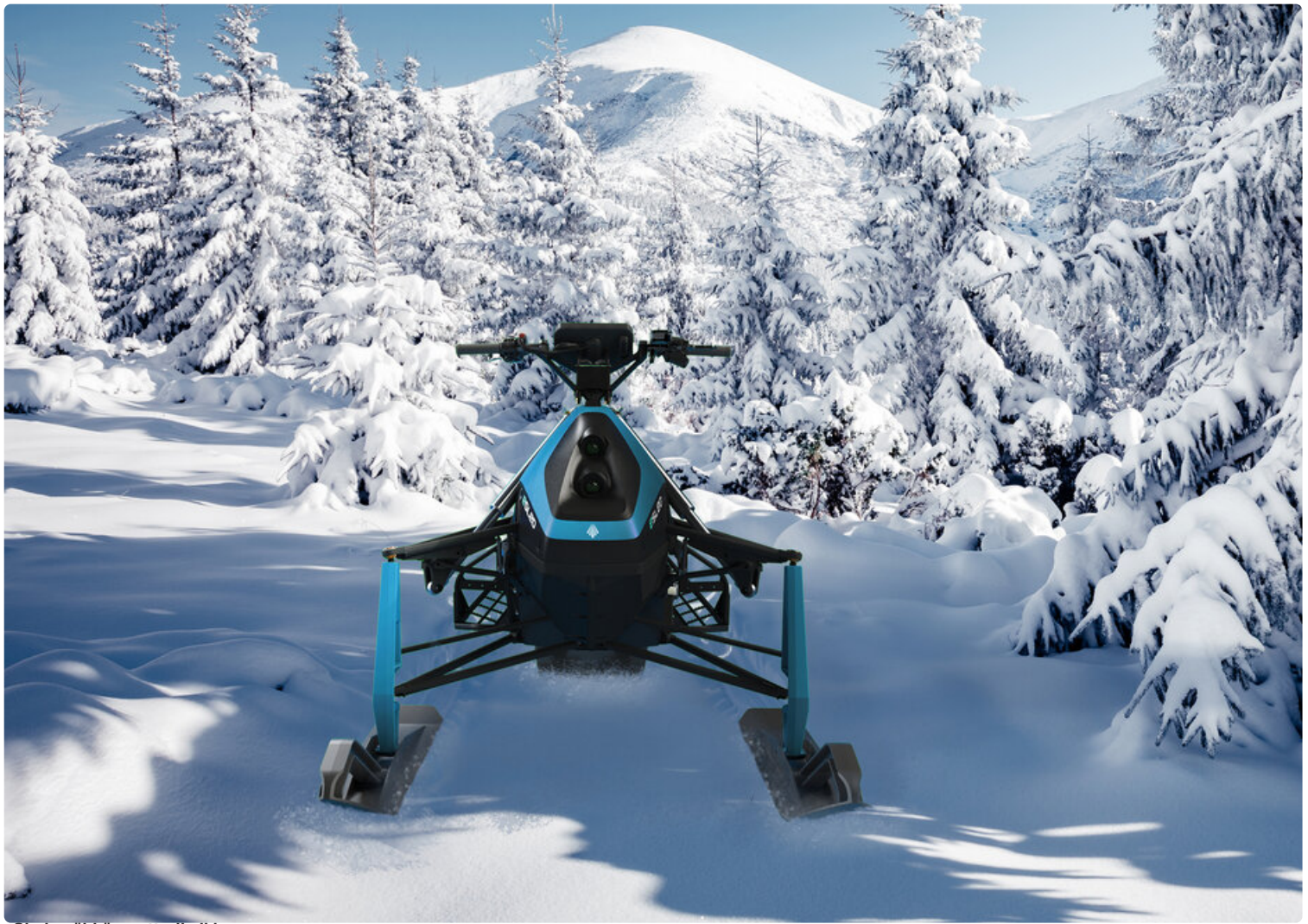
eSled - sähkömoottorikelkka.