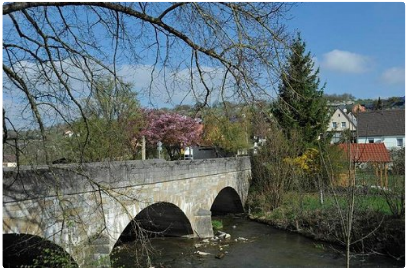
Kevään värikülläisyyttä. Vanha silta ja kirsikkapuu.