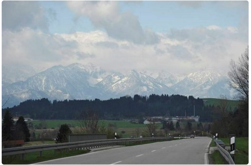
Matka alkaa tai loppu on silloin, kun Alpit näkyvät.