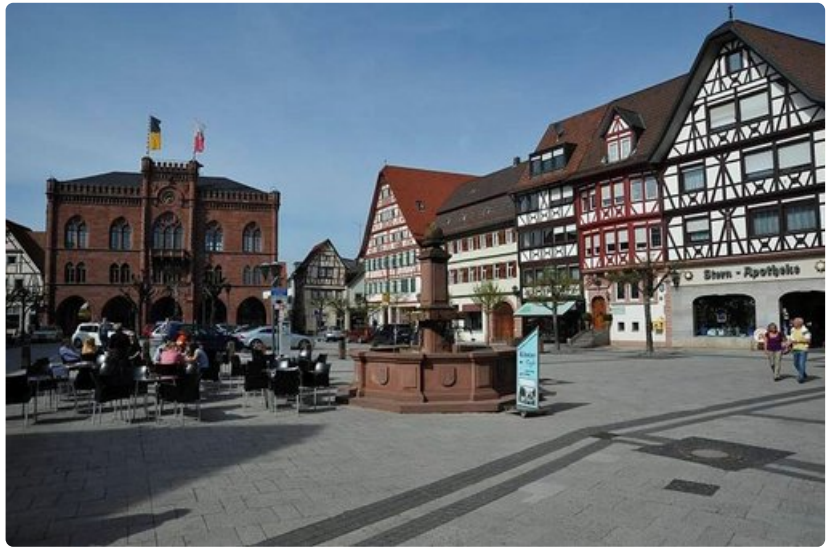
Tauberin tori sekä vanha raatihuone.

Friedberg on melko vaatimaton kylä, mutta seuraava taajama taas mitä uljain. Sen läpi virtaava joki lisää sen viehättävyyttä.