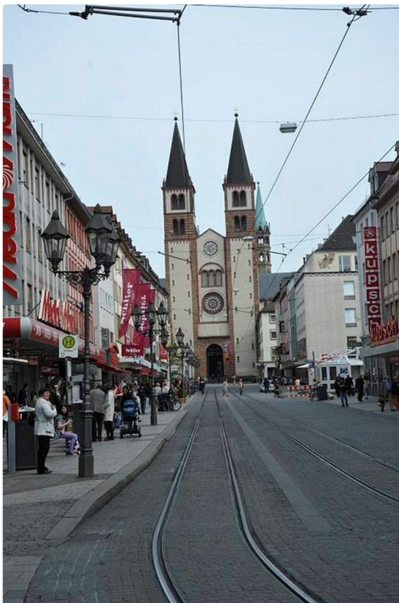
Würzburgin vanha kaupunginportti.