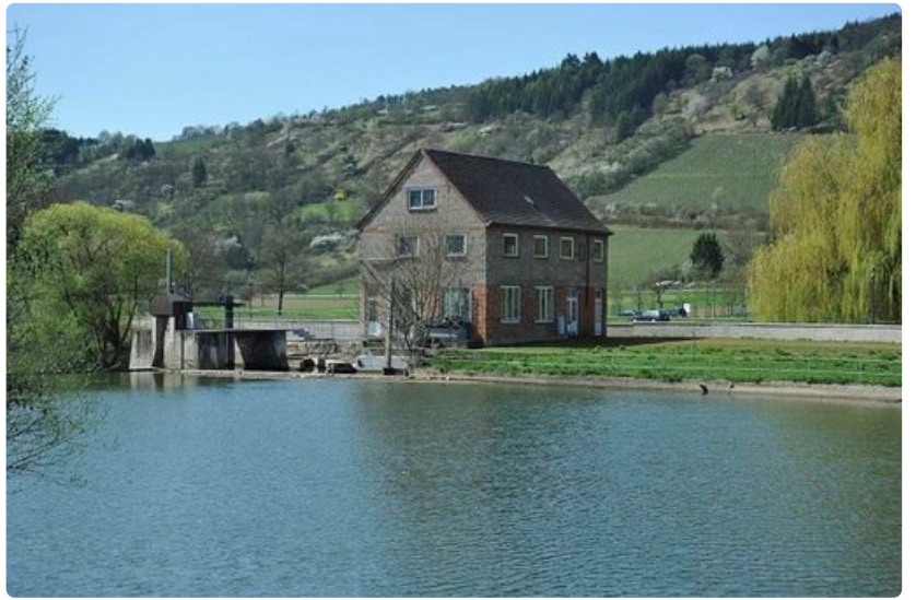
Tauber-joki. Rinteessä viinipensaita.