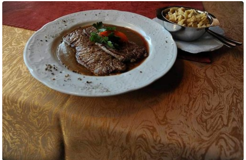
Spätzle & pihvi.