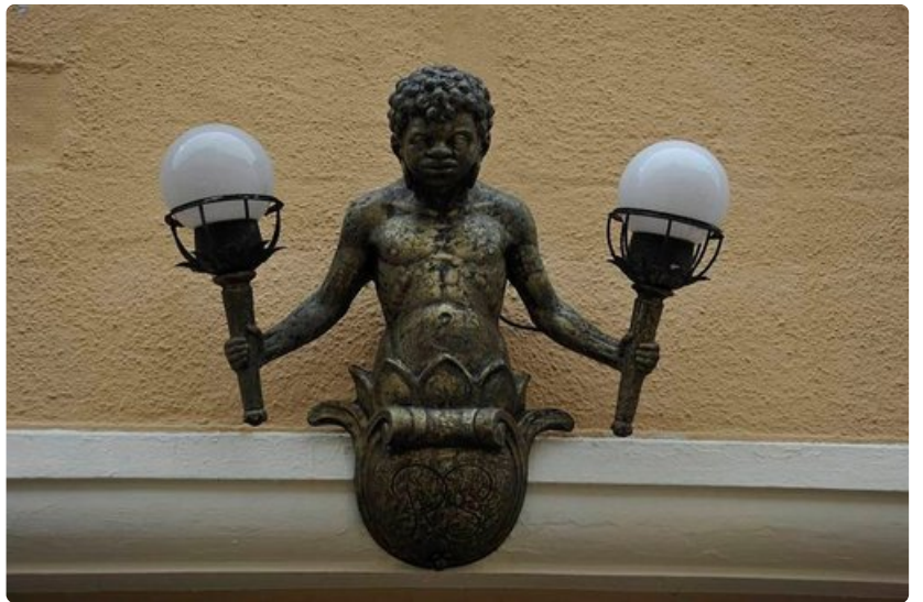
Hauska yksityiskohta. Lamppupoika Füssenissä.