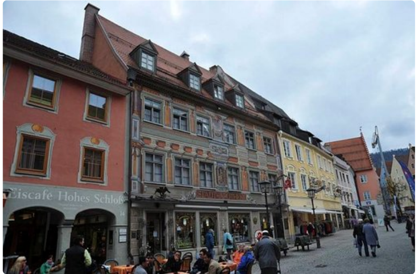
Füssenin koristeellinen apteekki.