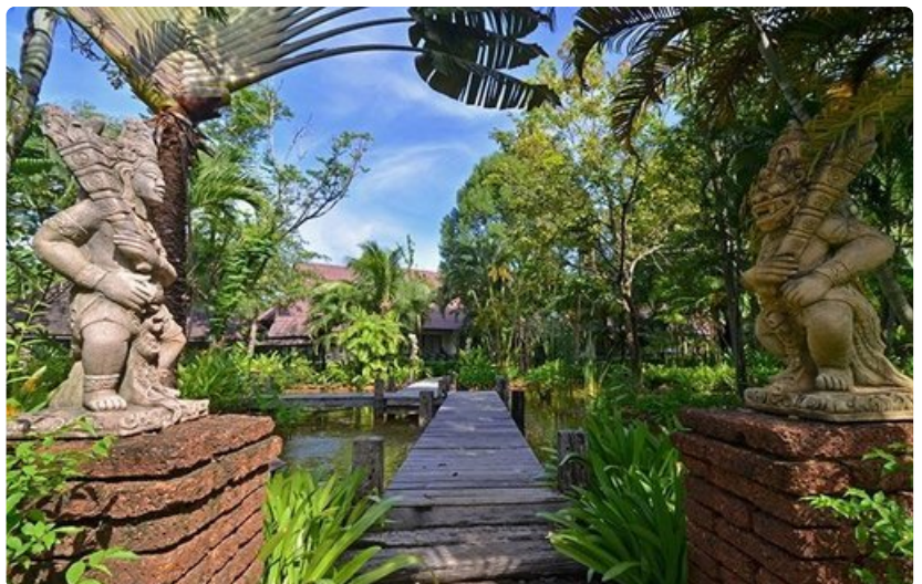
Koh Chang, Thaimaan toiseksi suurin saari