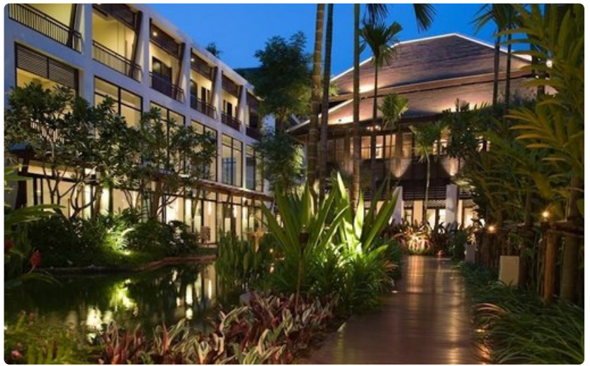
Chiang Mai, Pohjois-Thaimaan ruusu