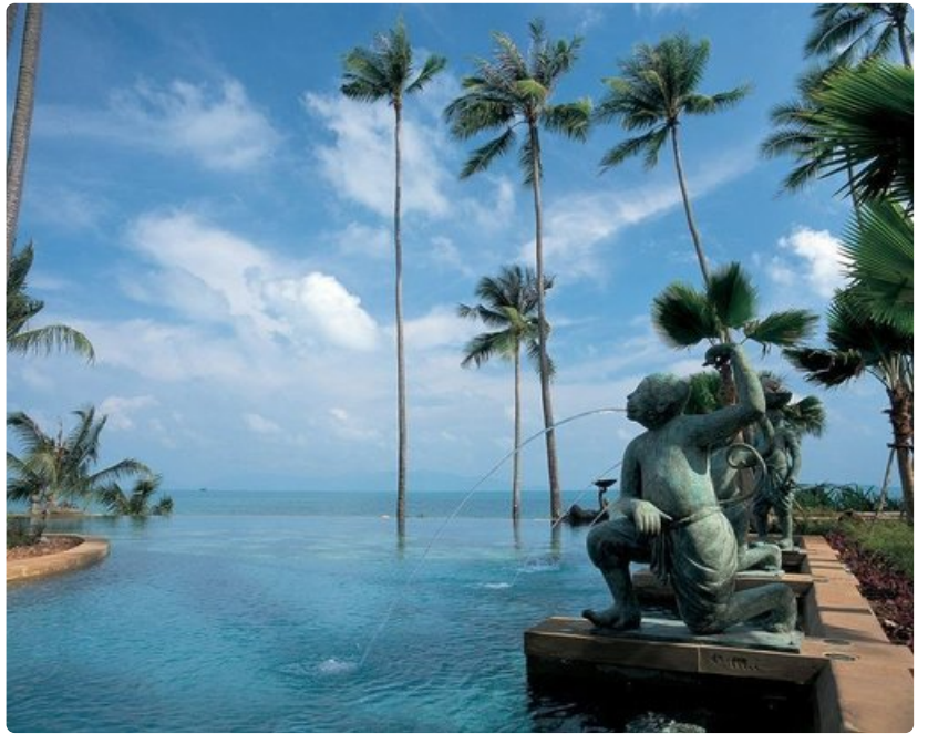
Koh Samui, Siaminlahden huippukohde