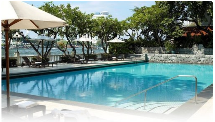
Bangkok, Aasian New York