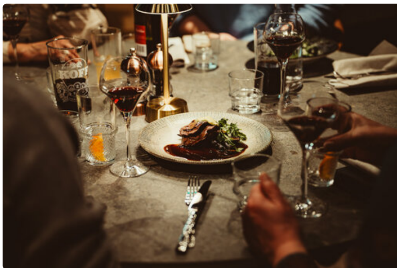
Levi Restaurantsin ravintoloita ovat Gondoliravintola, V'inkkari, Sivakka, Draivi, Horizont, Café Zero, Palovartija sekä uusimpana tulokkaana parhaaseen hiihtolomasesonkiin avannut Bistro West.