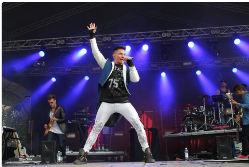
Antti Tuisku huokui itseluottamusta.