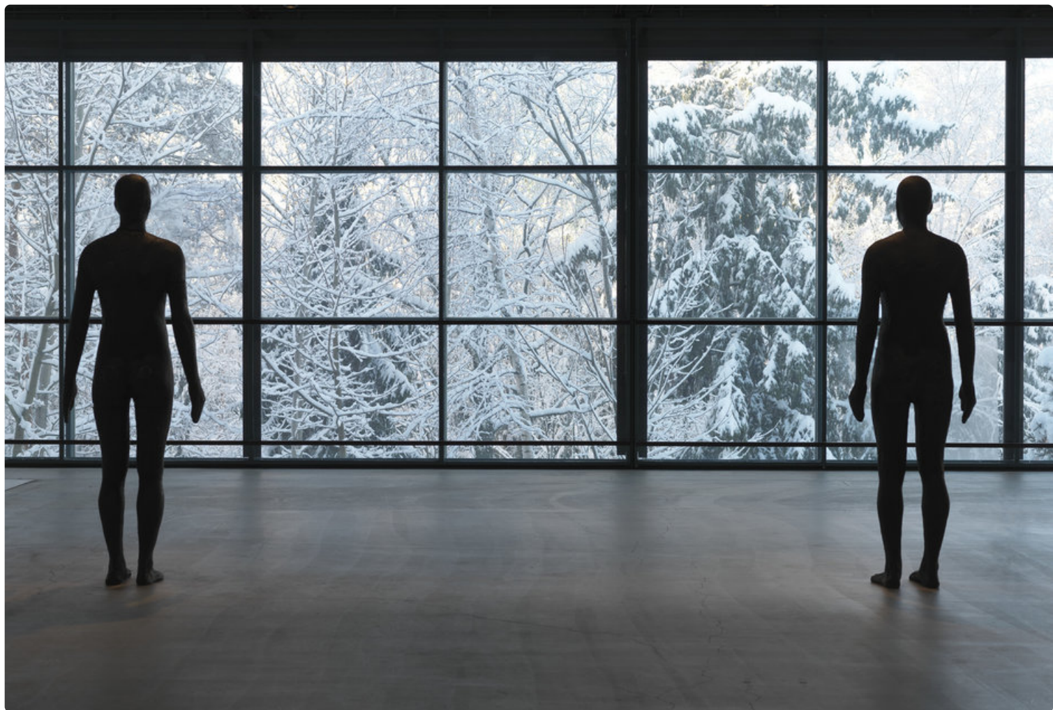
EMMA - Espoon modernin taiteen museo on Vuoden museo 2018.