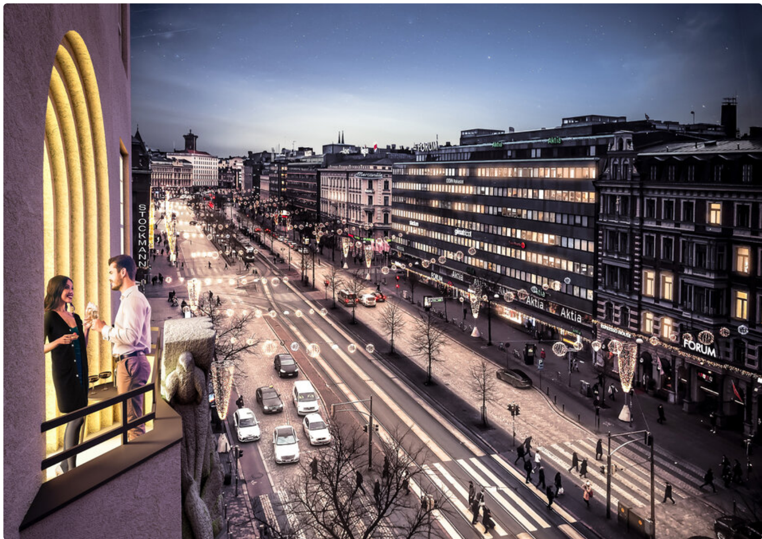
Näkymä Grand Hansa -hotellin ylimmästä kerroksesta Mannerheimintielle.