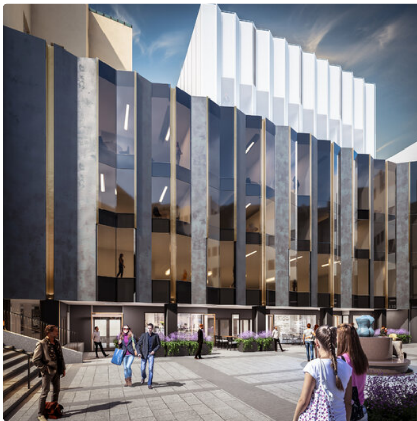
Grand Hansa -hotellin julkisivu Kaivopihalta katsottuna.

Ylvan tavoitteena on saattaa hotellityömaa valmiiksi vuoden 2023 loppuun mennessä, ja uuden hotellin on tarkoitus avautua vuoden 2024 alkupuolella. Minor Hotels tiedottaa avautumisen aikataulusta myöhemmin syksyllä