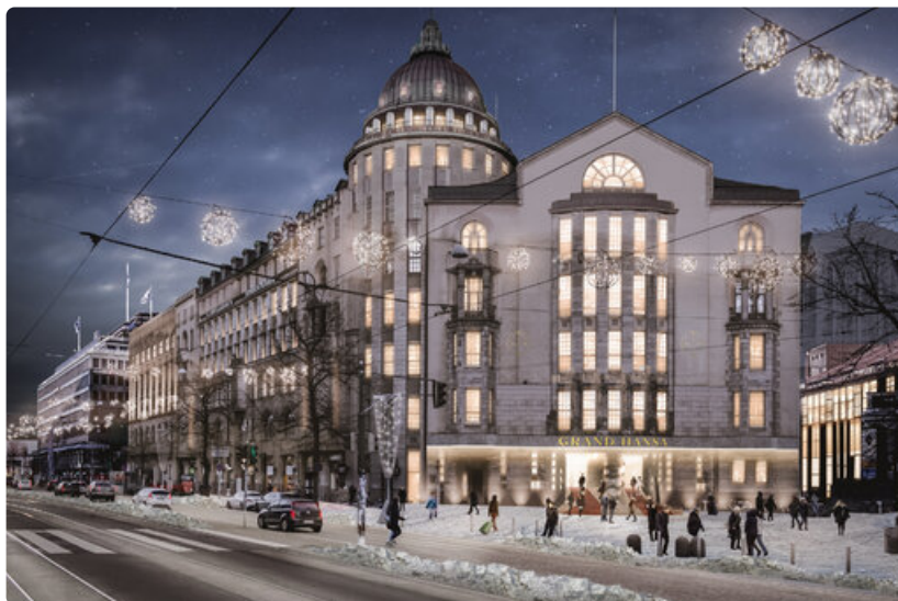
Grand Hansa -hotellin sisäänkäynti Ylioppilasaukiolla.