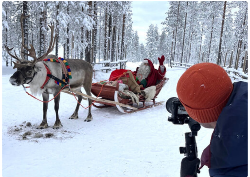
Santatelevision kuvaa joulupukki rekiajelulla Lapissa, Rovaniemen ympäristössä ja Pellossa.