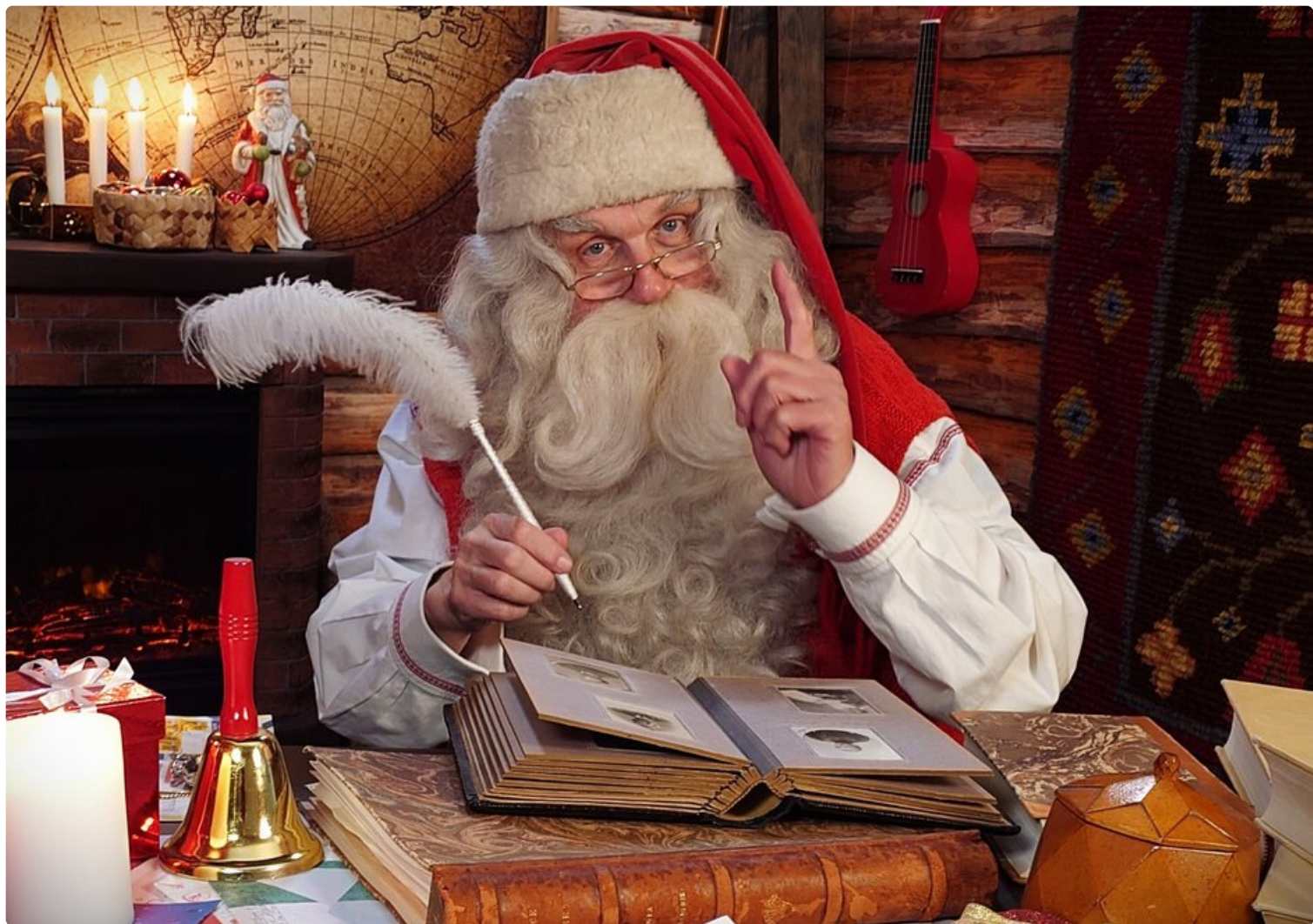
Joulupukki kuvattuna Santatelevision studiolla.

Joulupukin Youtube-kanava Santatelevision tuplasi jouluna katsojamääränsä ja jättää nyt X:n