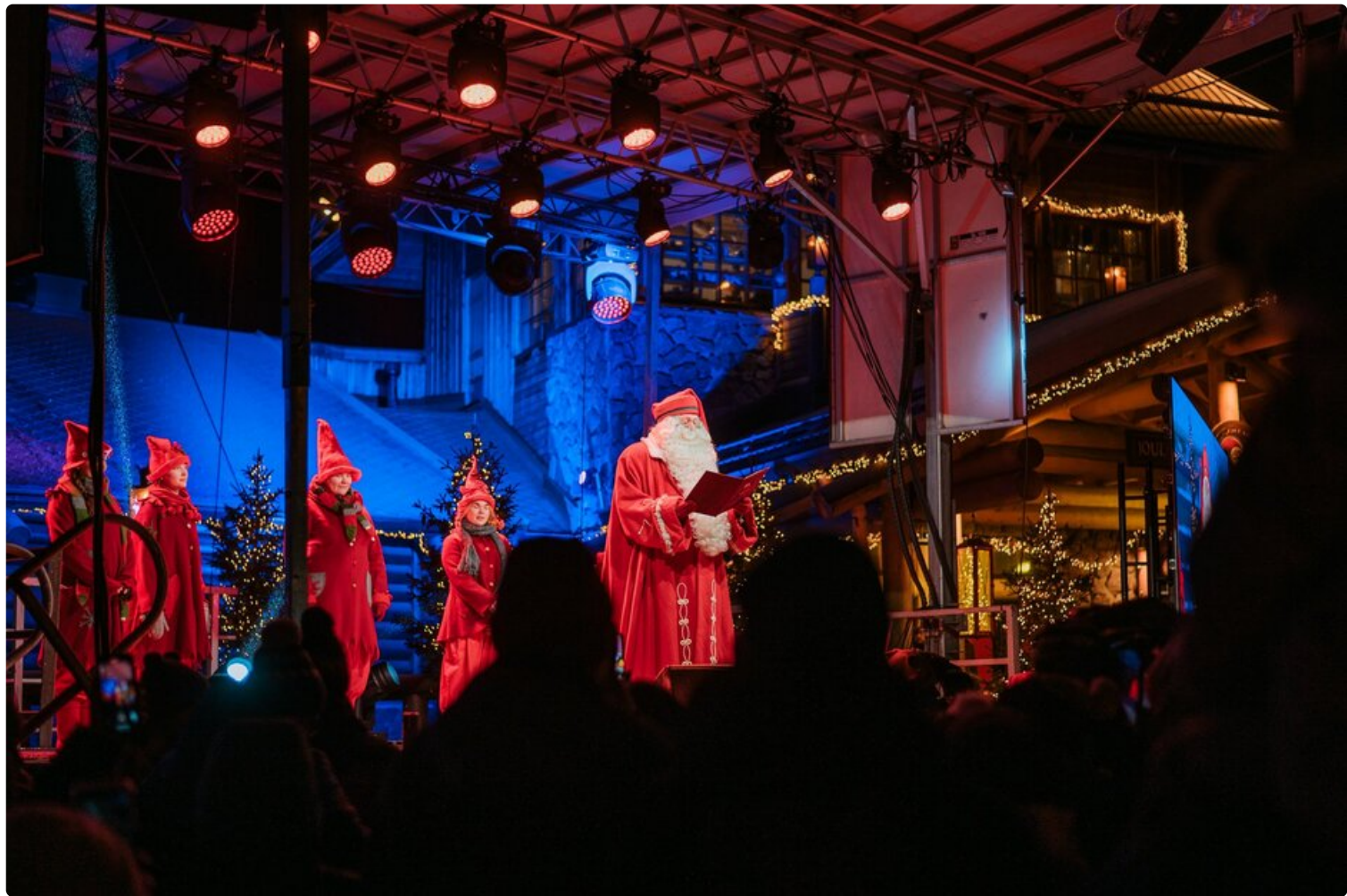
Rovaniemen joulun avaus kahden vuoden takaa.