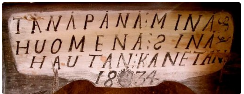
"Tänään minä, huomenna sinä, hautaan kannetaan", on kirjattu ruumiinkantopaareihin vuodelta 1834.