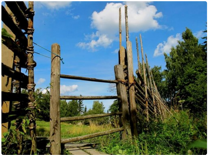
Lammasaitauksen portista astuessa tehdään aikahyppy menneeseen.