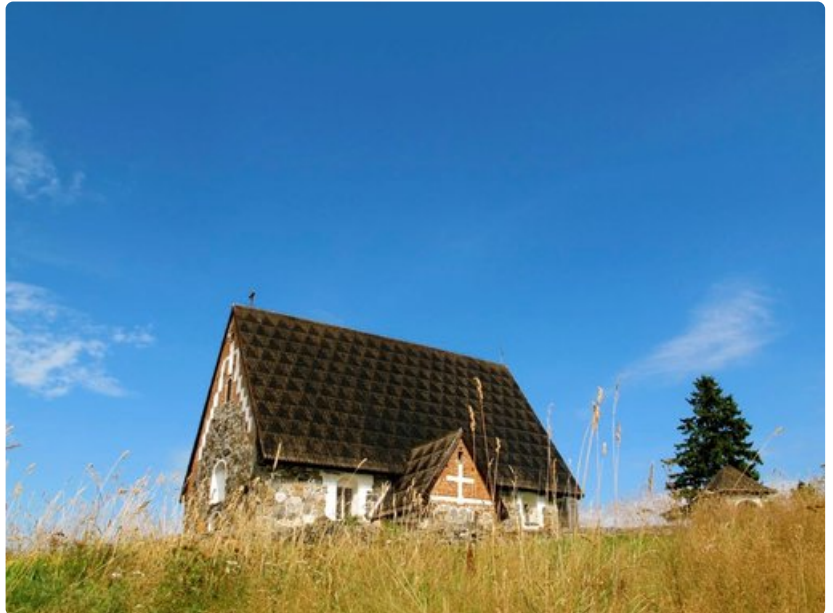
Tyrvään Pyhän Olavin kirkko on yksinkertaisuudessaan näyttävä ilmestys.