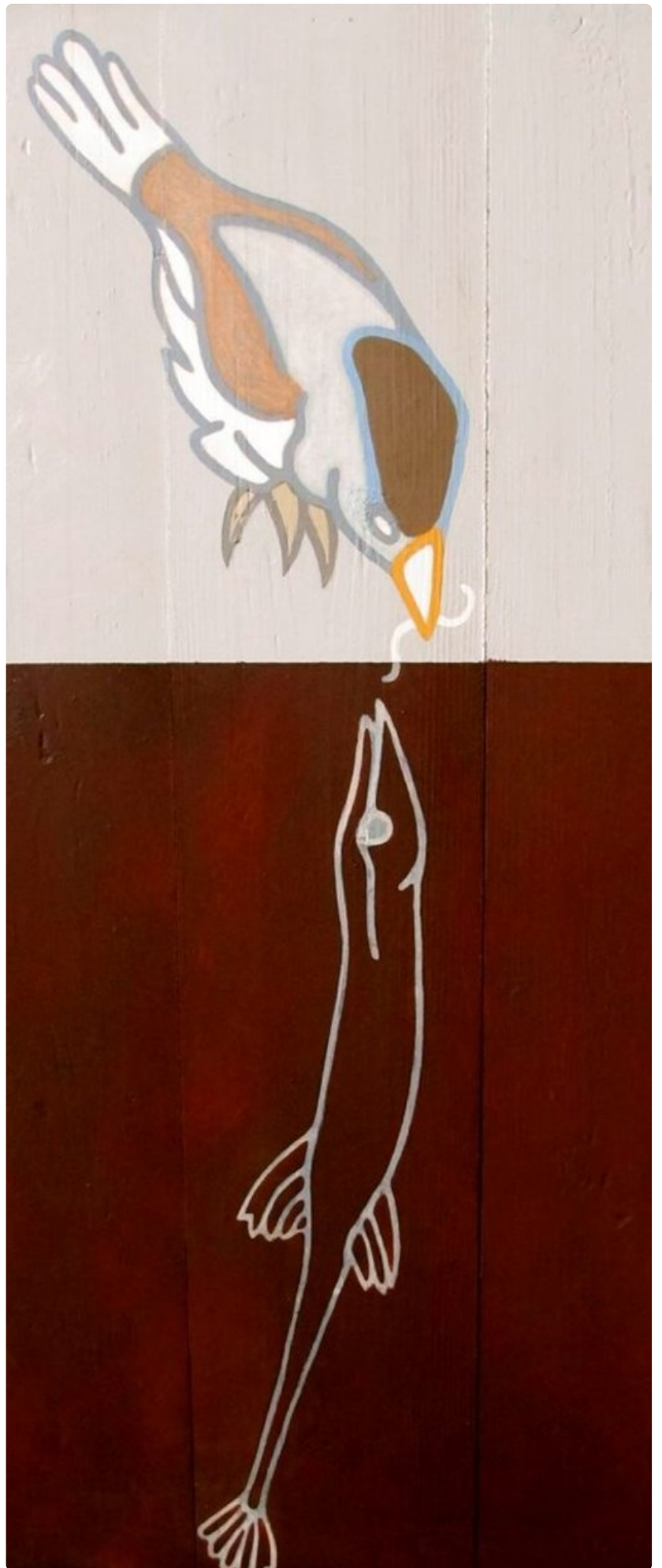
Luomiskertomuksen viides päivä - Evät ja siivet.