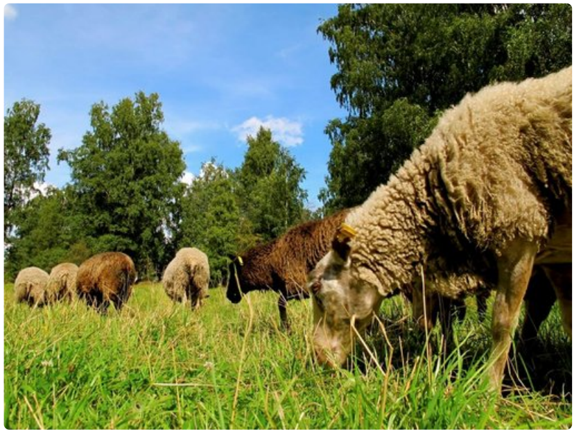
Lampaat laiduntavat kesäisin Vehmaanniemessä.