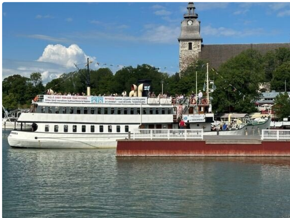
Höyrylaiva Ukkopekka Naantalin vierassatamassa