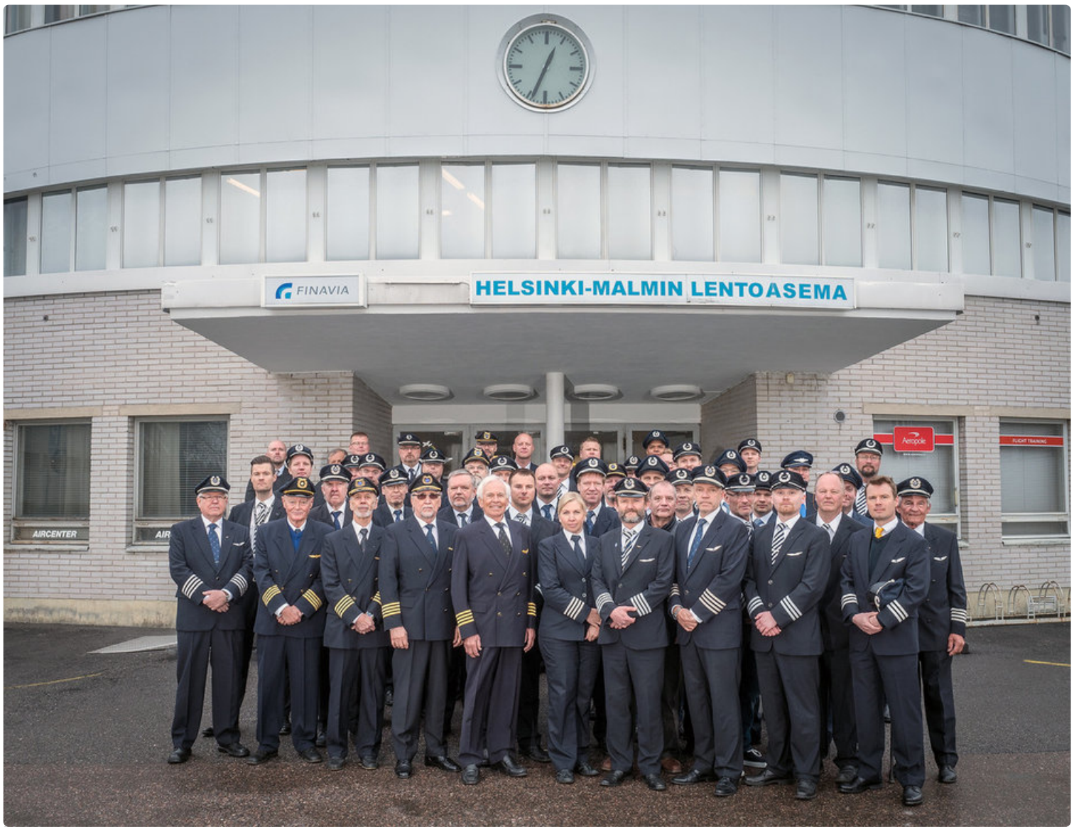
Nykyiset, entiset ja tulevat liikennelentäjät ryhmäselfiessä Helsinki-Malmin lentoasemalla.