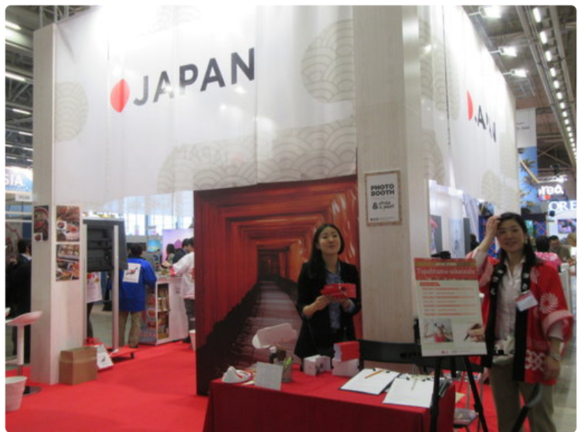
Japani tarjoaa 3G-elämyksiä.