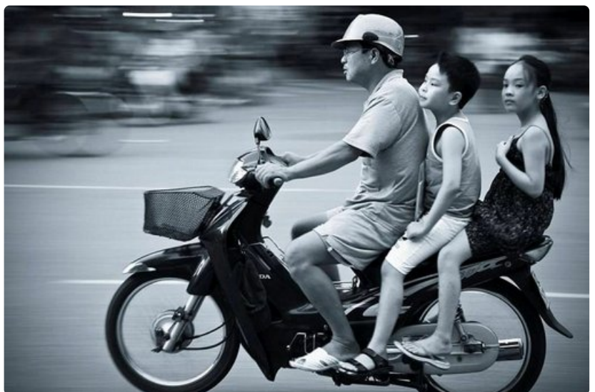
Matkalta palattua kuvat kannattaa käydä heti läpi ja miettiä, miten ne parhaiten esittää.