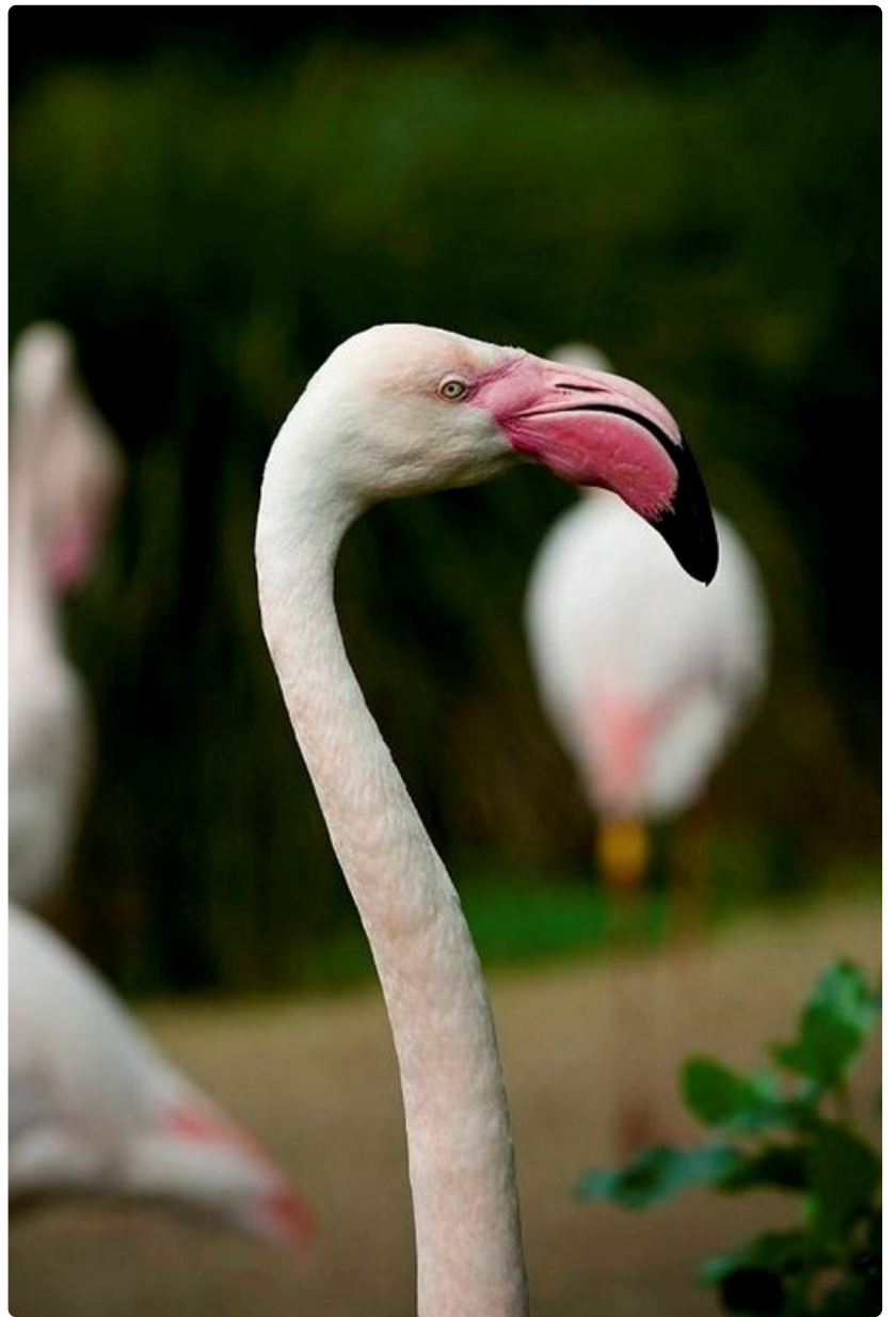
Eläimiä kuvatessa kannattaa käyttää pitkää zoom-linssiä.