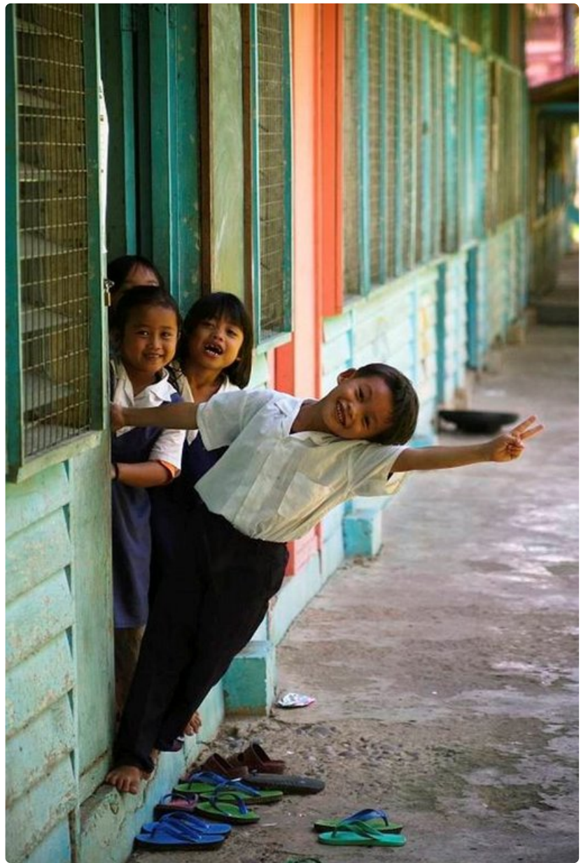
Ihmisten kuvaaminen on yksi matkakuvaamisen parhaita puolia. Varsinkin lapset jaksavat aina poseerata.