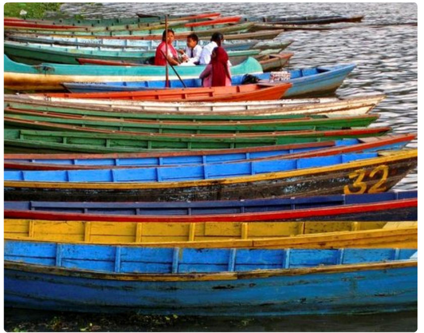
Erlaisia kuvakulmia kokeilemalla löytää sen oikean.