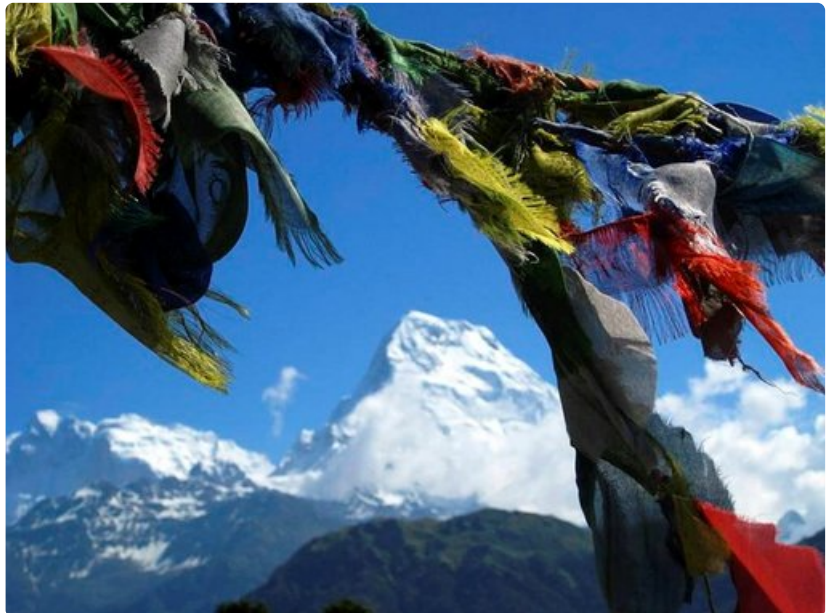
Tarinan kerronta on tärkeä osa matkakuvamista.