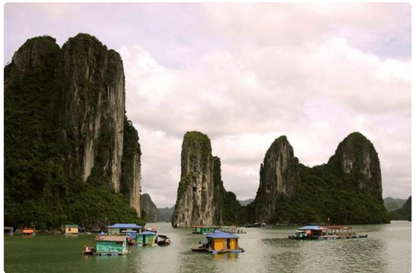
Koeta linkittää maisemat paikalliseen elämäntyyliin.