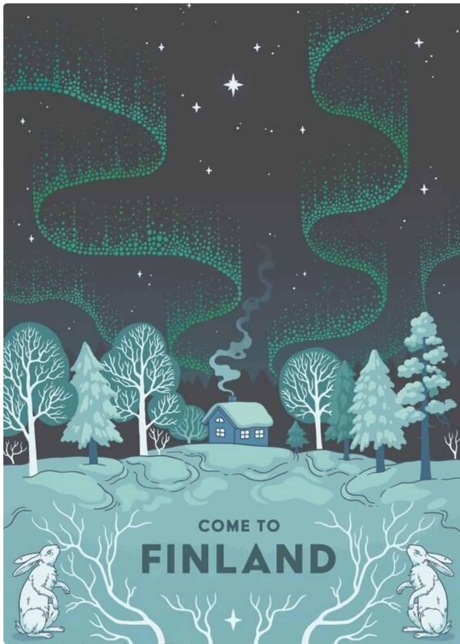
Northern Lights Over the Cottage, Tiina Jatkola