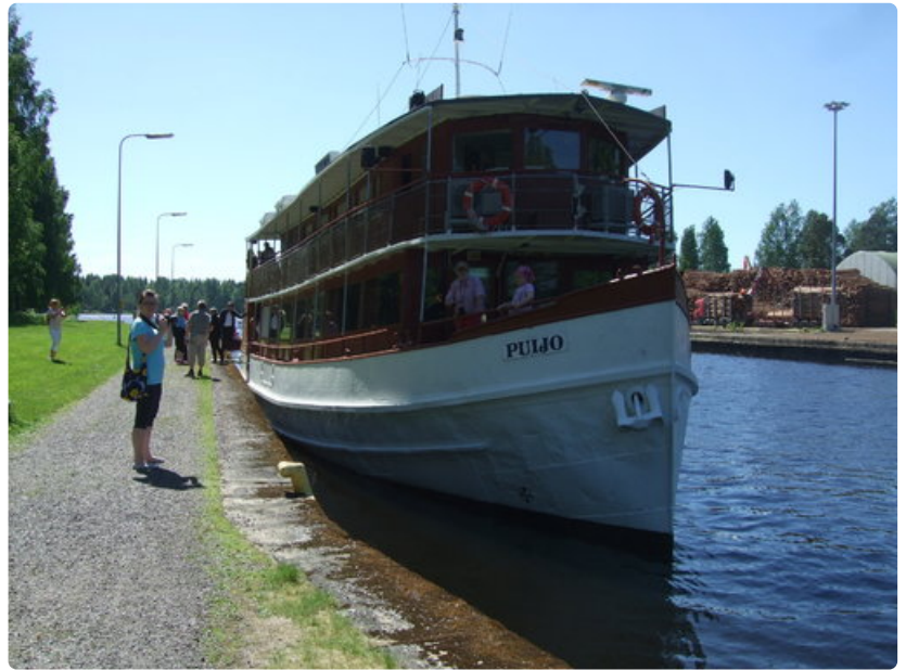
Kahdenkymmenen vuoden tauon jälkeen matkustajalaiva on kiinnittynyt laiturin Varkaudessa. Kuvassa Puijo odottelee pääsyä Taipaleen kanavaan.