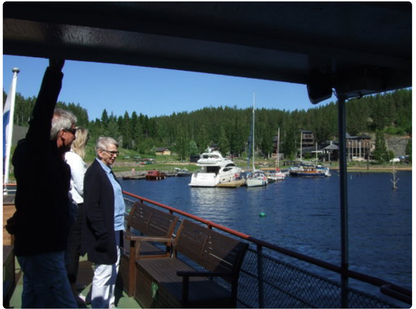
Järvisydämessä Puijo kävi vain pyörähtämässä, sillä laituripaikkaa ei laivalle sopimuksesta huolimatta löytynyt. Saimaan suurimmalle huvijahdille kyllä oli laituritilaa.