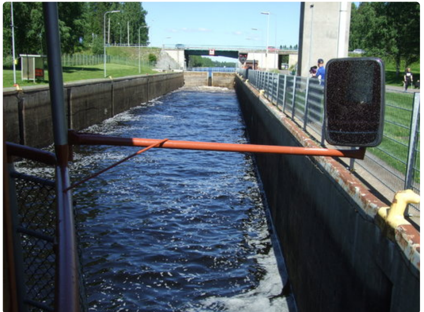
Sulku täyttyy, ja pian Puijo lähtee ylittämään Unnukanselkää.