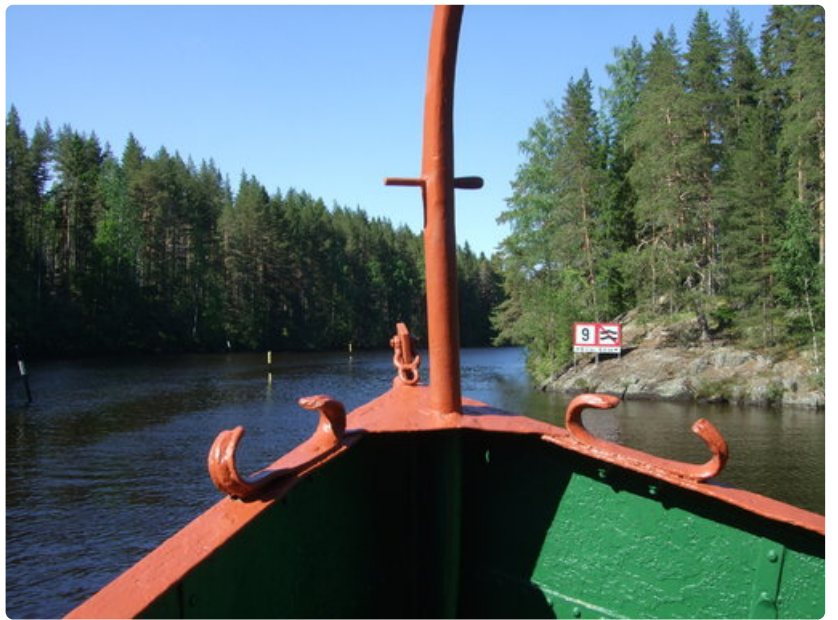
Yksi reitin viehätöksistä piilee aavojen ulapoiden ja salmien vaihtelussa. Leppävirran kapeikossa kapteenin on oltava tarkkana.