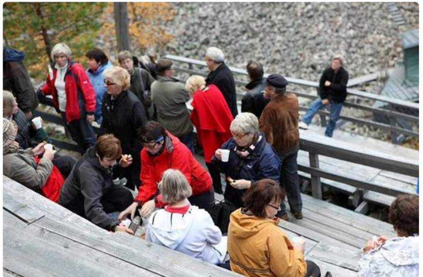
Jazzin ystävät piknikillä Aittakuruun katsomossa.