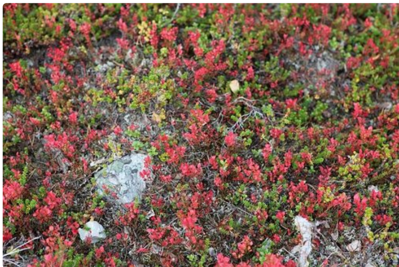
Swingien aikaan maaruska on kauneimmillaan.