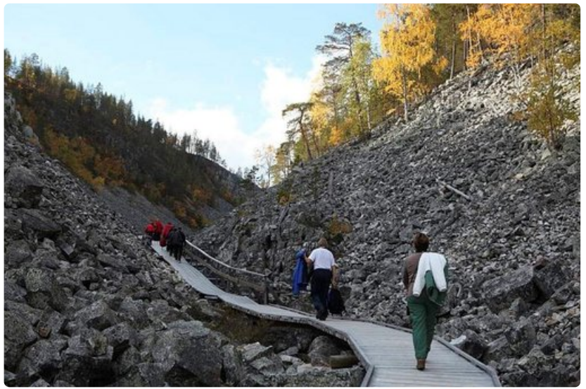
Matka Aittakuruun luonnon konserttisaliin on elämys.

Murikkaseinämät leviävät luonnon amfiteatteriksi,