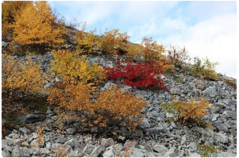
Pyhän kivikot, punaiset ja keltaiset lehdet ja jazz ovat sopineet yhteen jo yli kaksikymmentä vuotta.