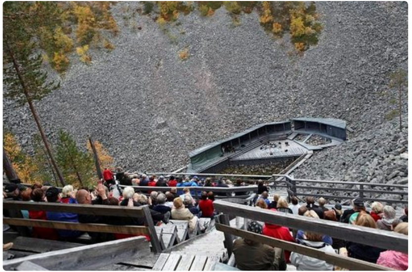
Akustiikka toimii Aittakurussa, vaikka muusikot näyttävät yläriviltä katsottuna muurahaisilta.