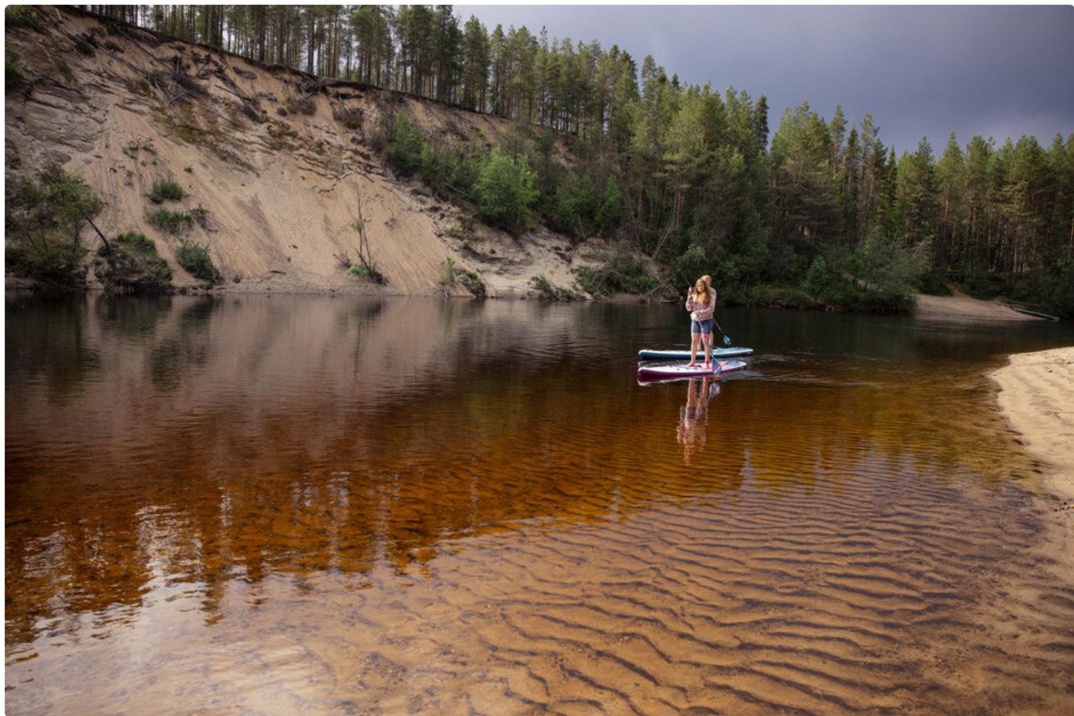
Ruka-Kuusamo Oulangan kansallispuisto.