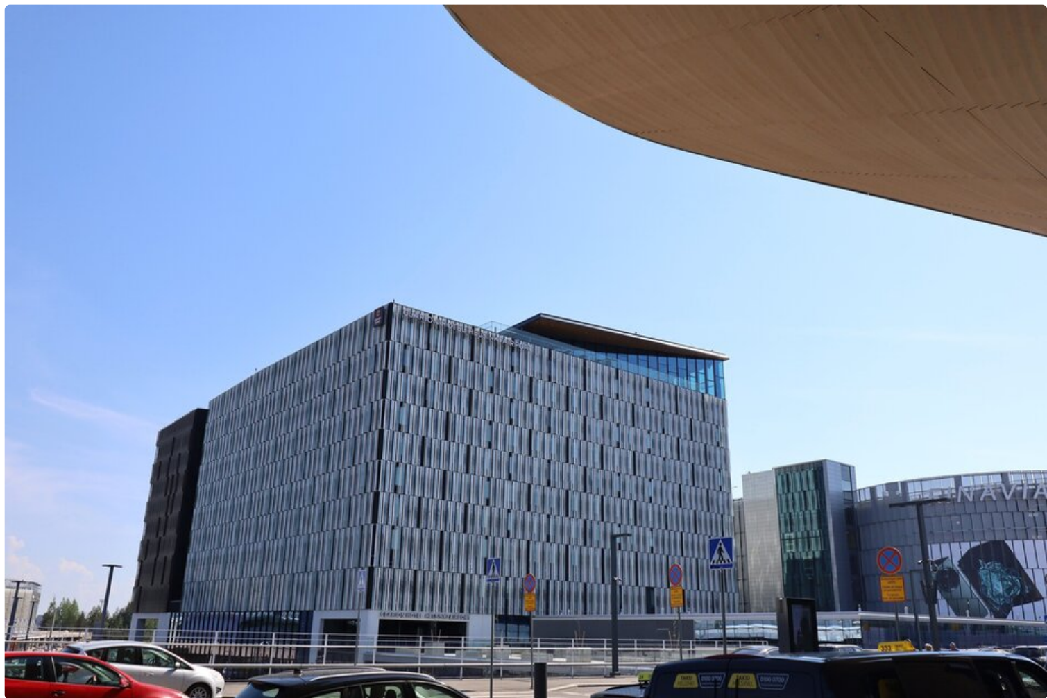
Uusi hotelli lentoaseman kupeessa.