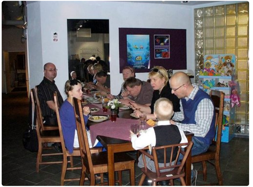
Tähtikokkien valmistama ruoka maistuu koko perheelle.