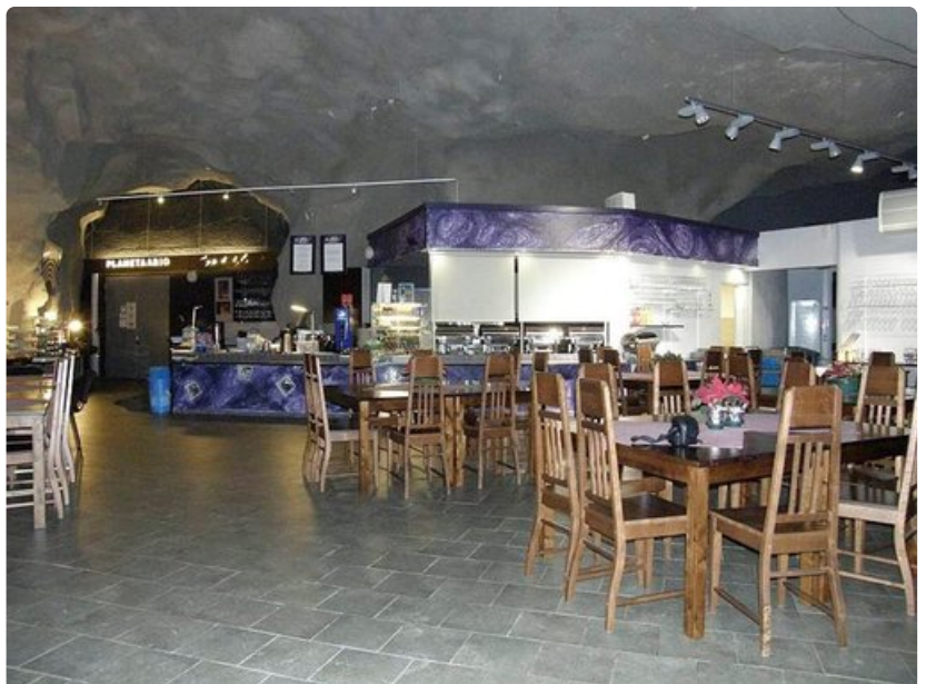
Kallioplanetaario on Nyrölän kylän sydän, joka palvelee niin kyläläisiä kuin vierailijoitakin.