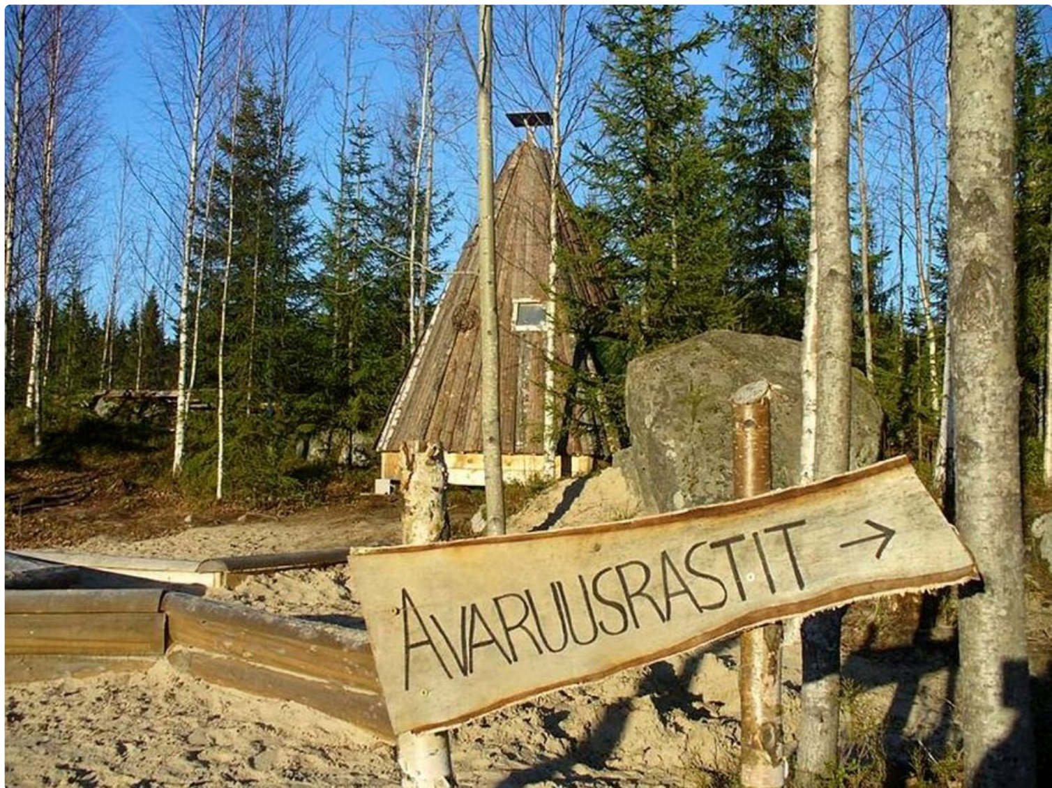
Visaisia avaruustehtäviä metsän keskellä.