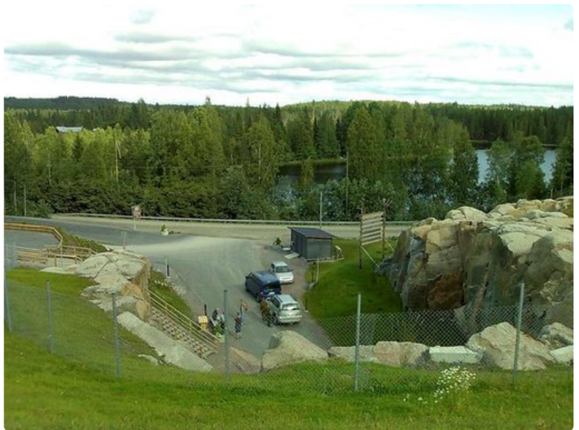
Kallioplanetaarion päältä avautuu keskisuomalainen järvimaaisema.