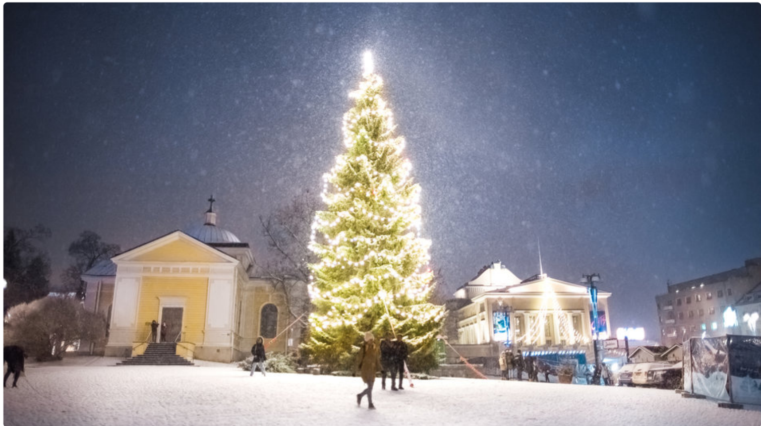
Tampereen joulua!