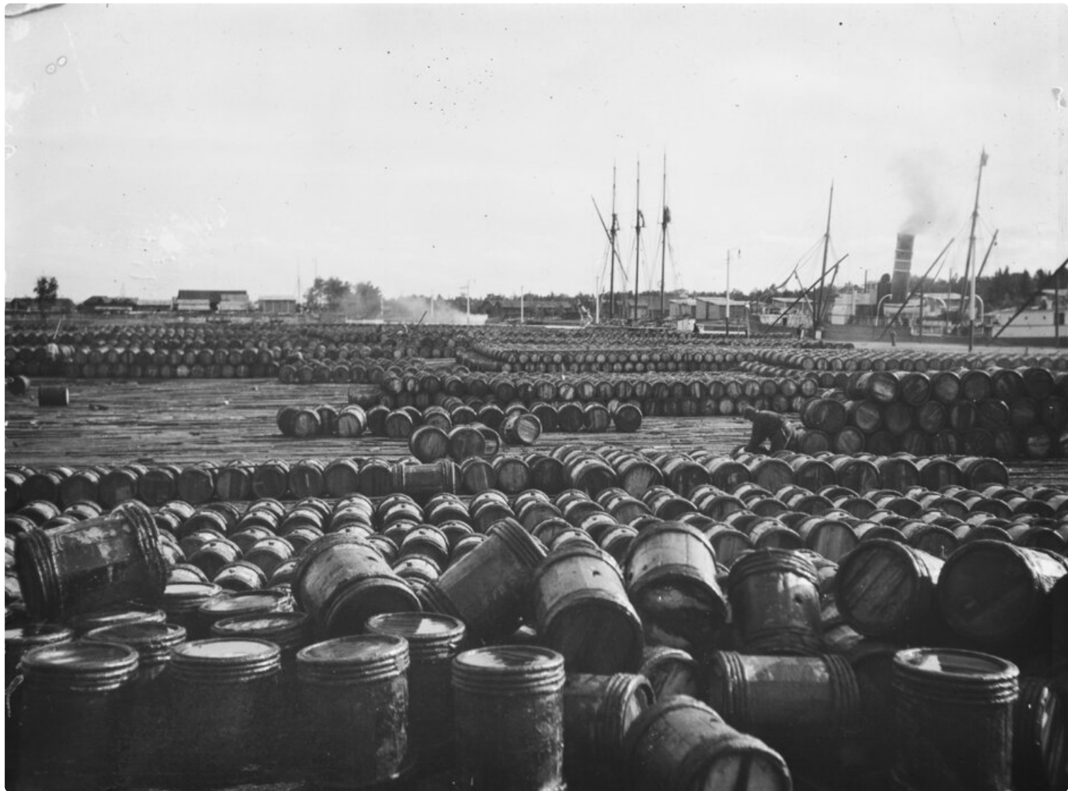
Oulun tervahovi, yksi Tervatarinoiden reitin pisteistä, oli tervan varastointi- ja tarkastuspaikka Toppilansalmen pohjoisrannalla.