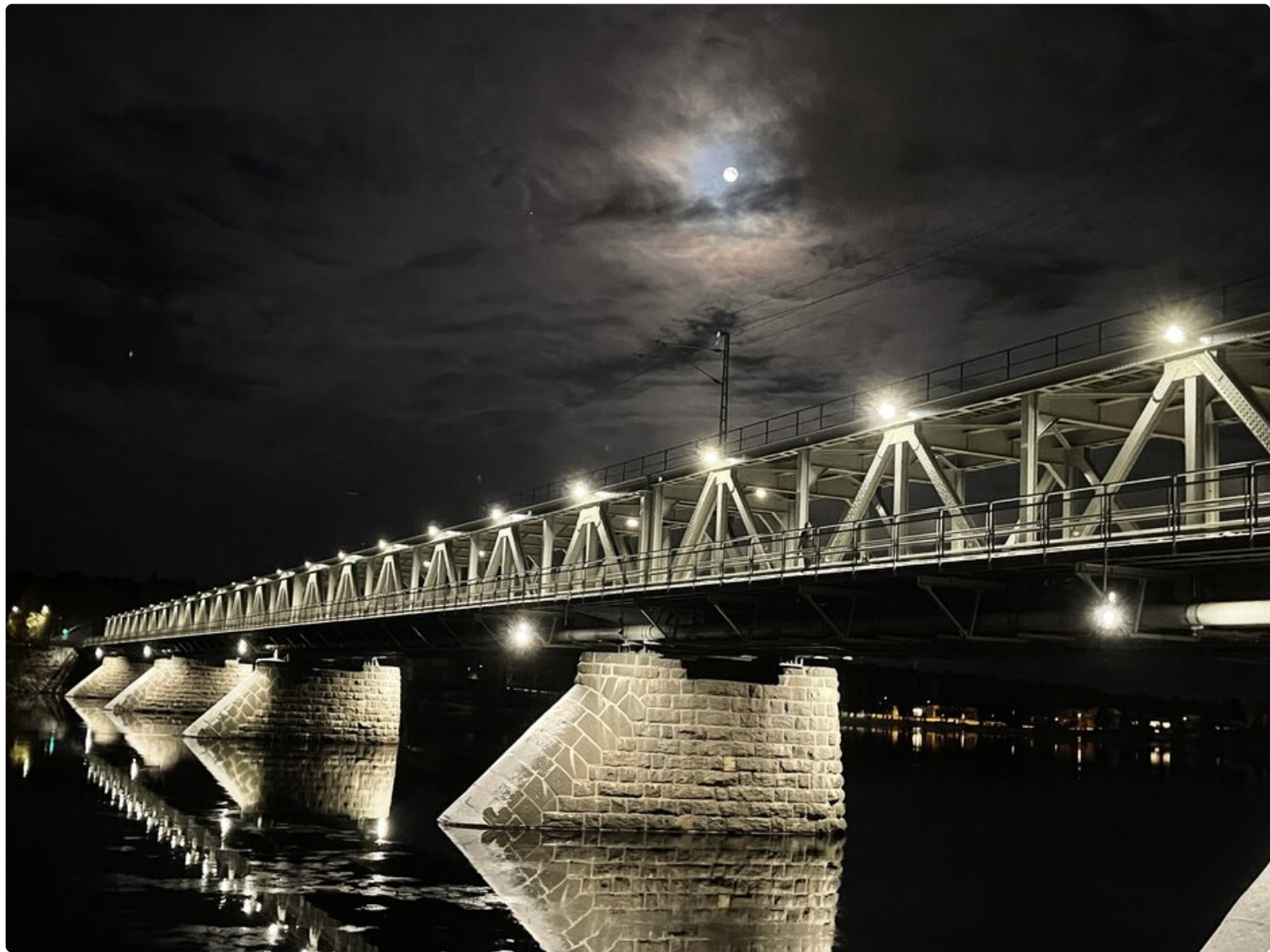
Rovaniemen yhdistetty rautatie-maantiesilta.