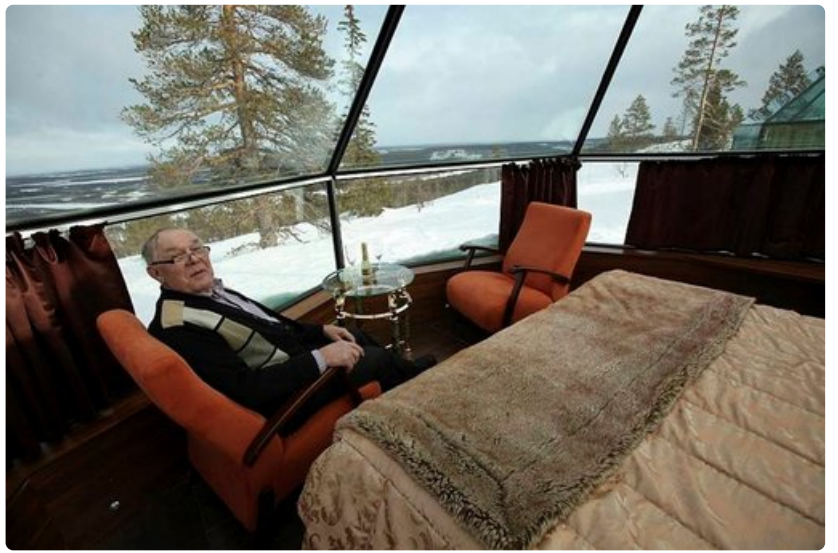
Levin iglut ovat syntyneen Tauno Mäkelän ideasta.