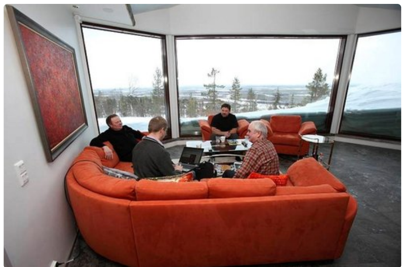
Neuvottelun välillä ajatuksen kirkastuvat...