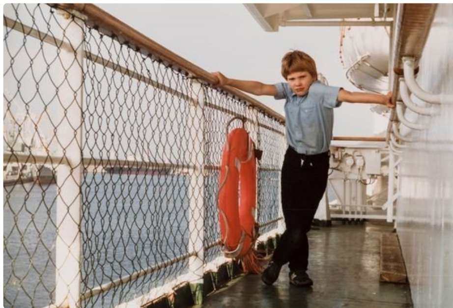
Georg Otsin kannella 1984.

Armas Tallinna –näyttelyssä kurkistetaan helsinkiläisten Tallinnan matkojen värikkäisiin tunnelmiin 1980-luvulta tähän päivään