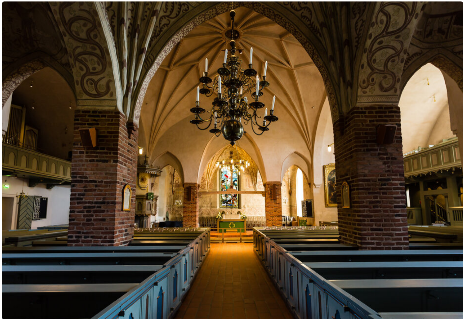
Espoon tuomiokirkko.