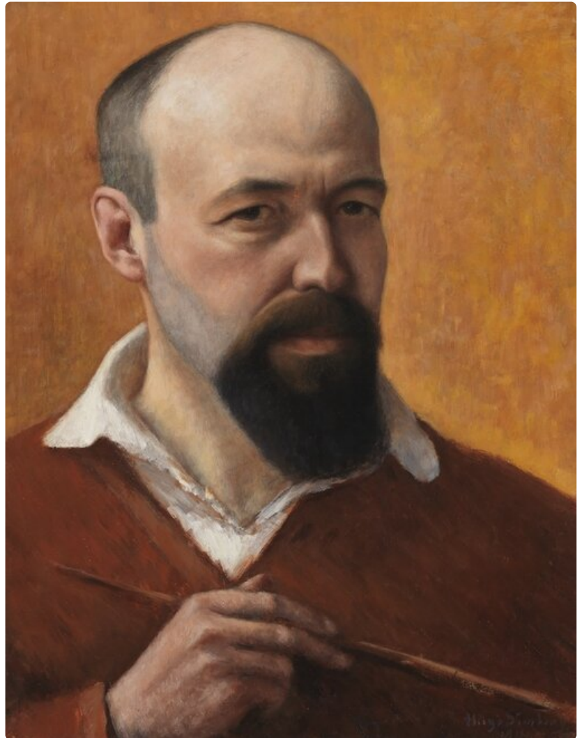
Hugo Simberg: Omakuva, 1914. Kansallisgalleria / Ateneumin taidemuseo, kokoelma Hallonblad.