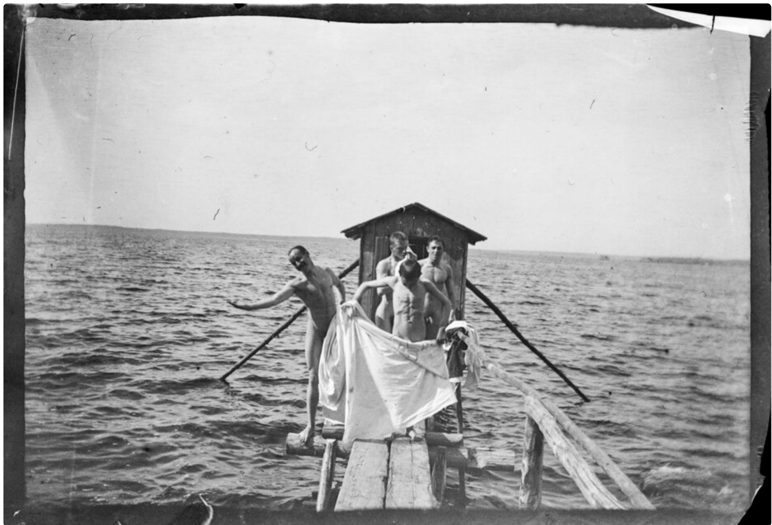
Simberg-sukua Selkärannan uimahuoneella, 1904.