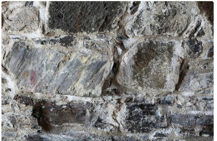
Olavinlinna on yli 500-vuotias.