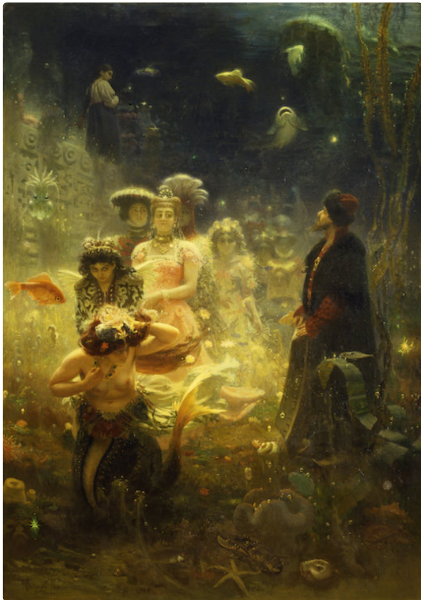
Ilja Repin: Sadko vedenalaisessa valtakunnassa (1876). Venäläisen taiteen museo.