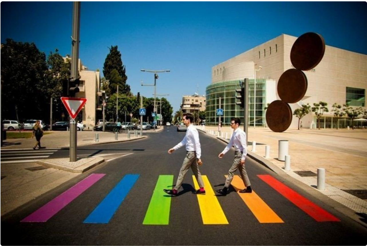
Israel on yllättäen noussut pridekansan suosioon.