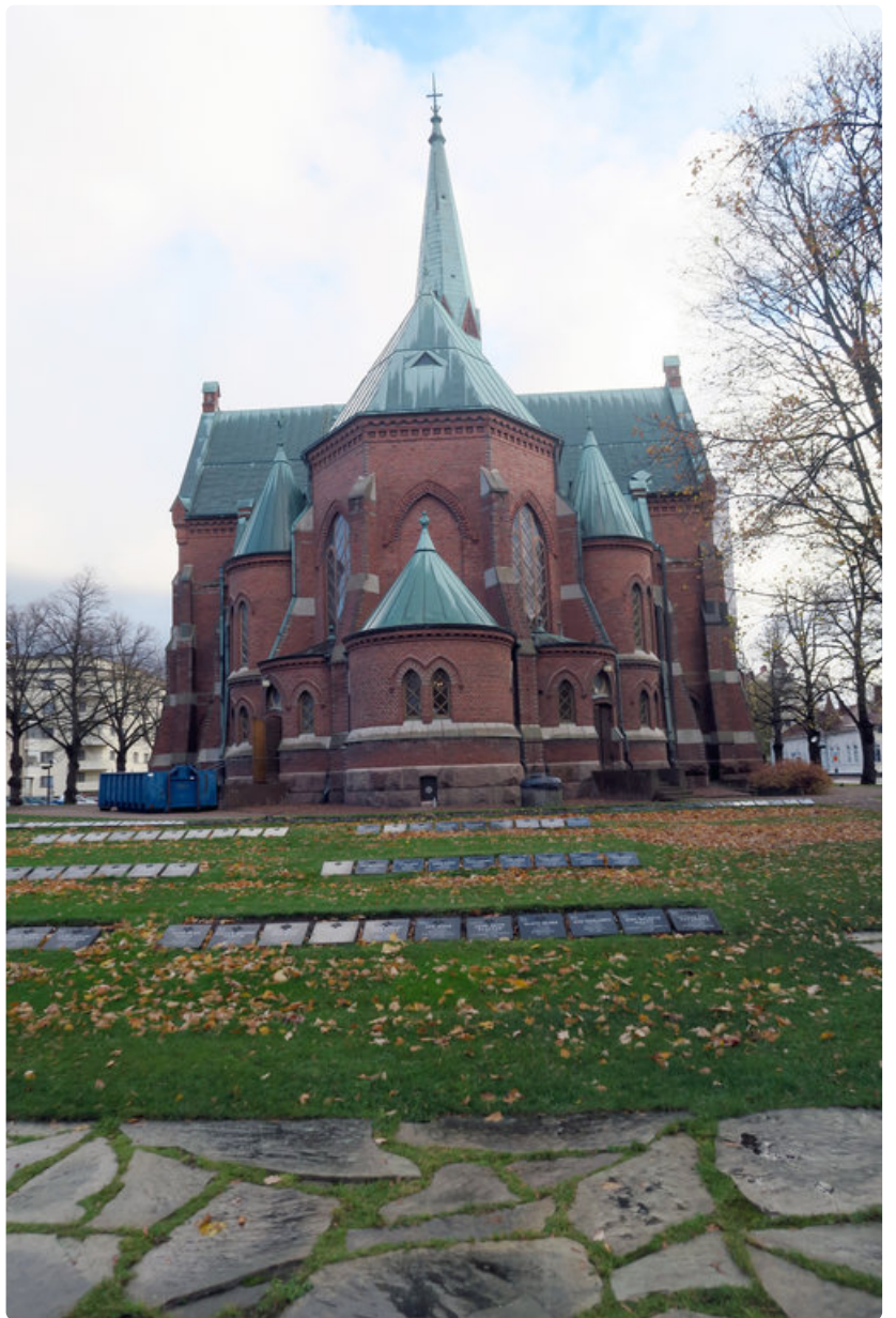
Kotkan uusgoottilaista tyyliä edustava punatiilinen kirkko kohoaa aivan kaupungin keskustassa.