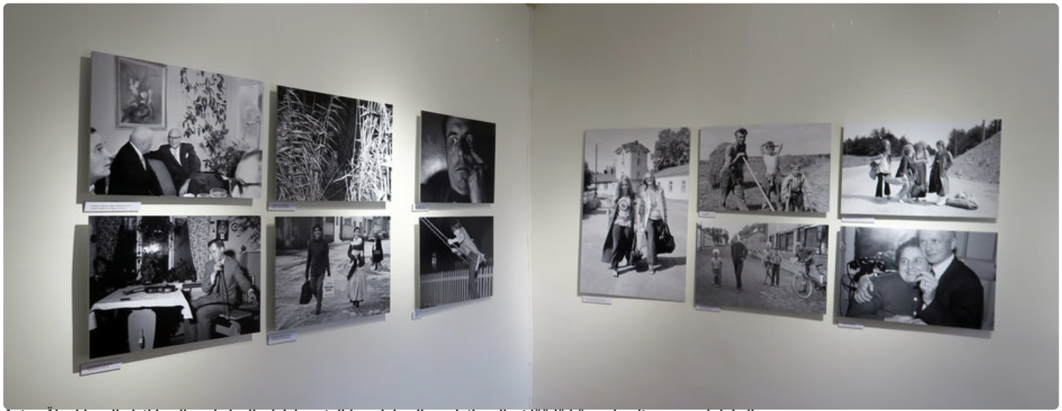
Aatos Åkerblom ikuisti Loviisaa ja loviisalaisia satoihin valokuvuiinsa, jotka olivat jäädä hänen kuoltuaan unohtuiksiin.