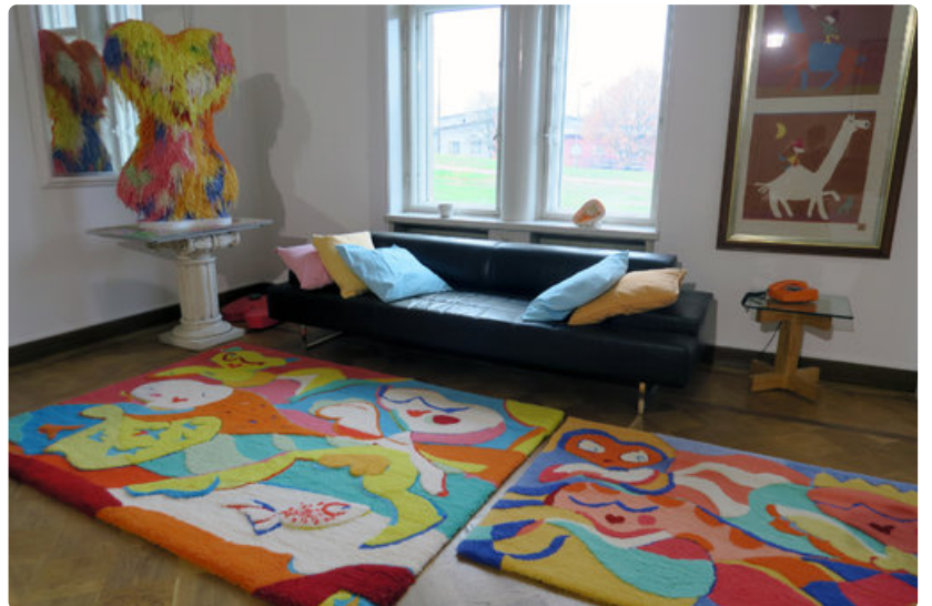
Riitta Nelimarkan värikkäät työt keventävät sopivasti vanhan graniittilinnan jyhkeää ilmettä.