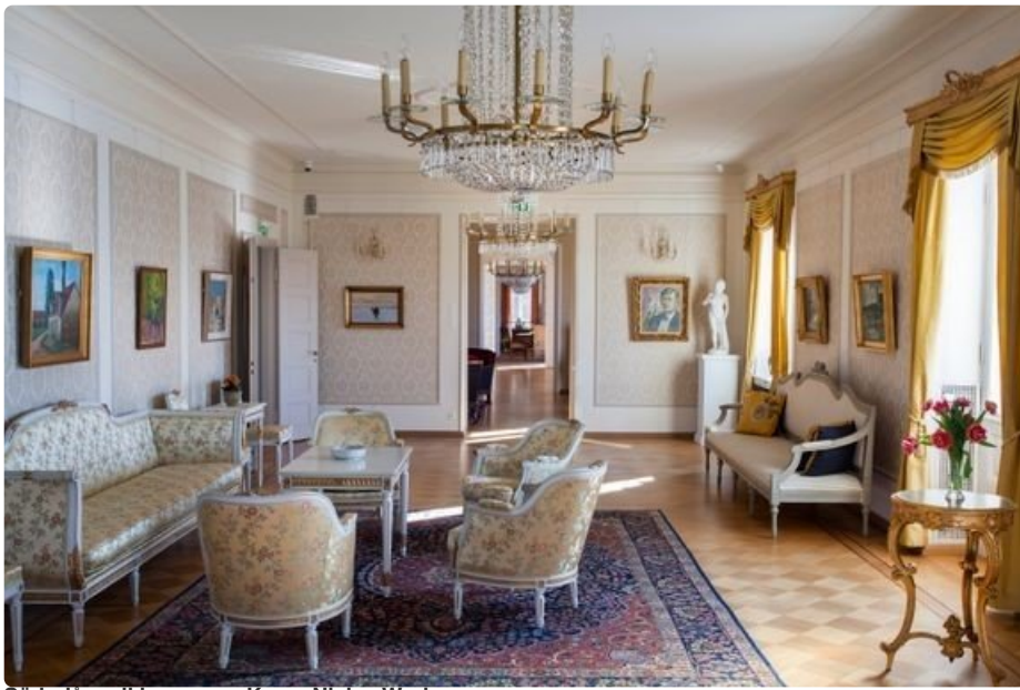
Söderlångvikin museo.