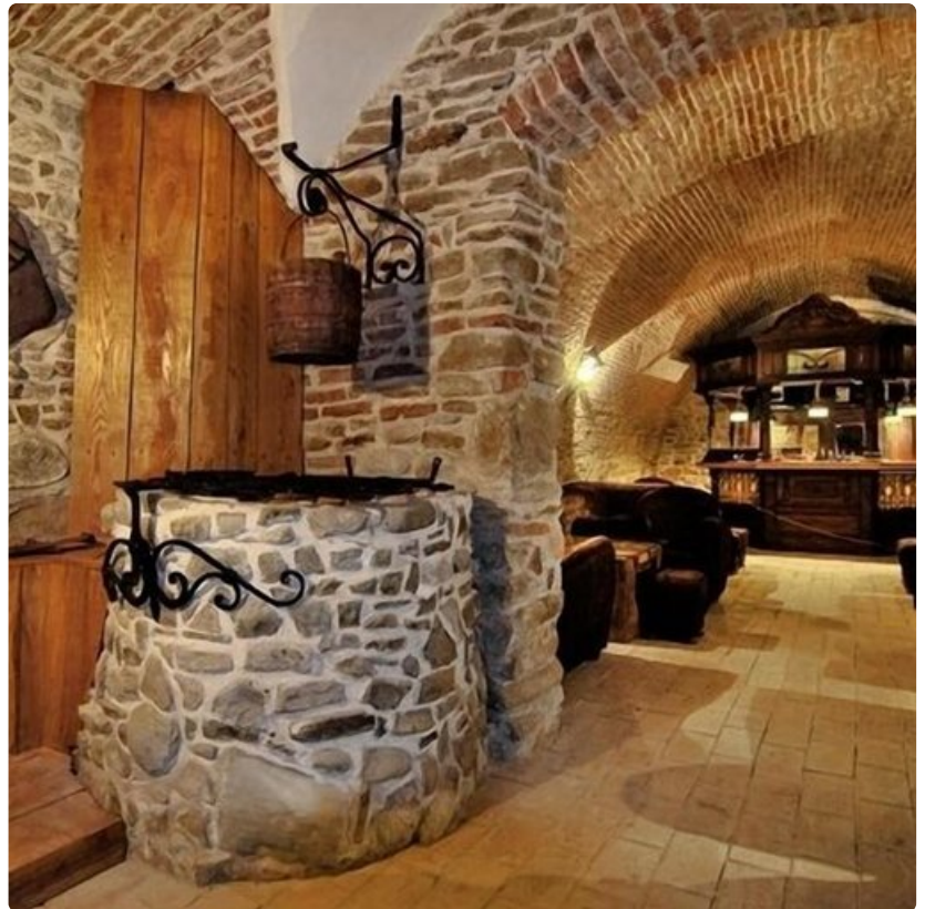
Fronius Residence, Sighișoara, Romania.