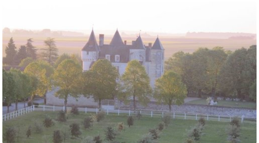
Chateau de Marcay, Ranska.