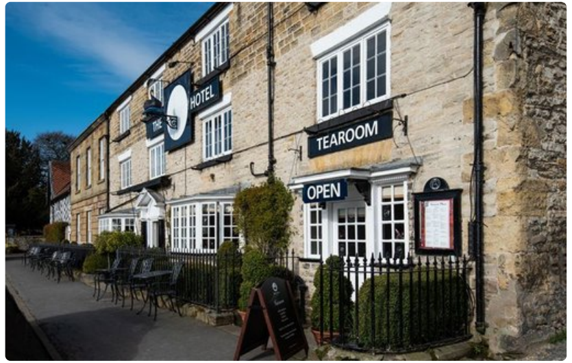
Black Swan Hotel, York, Englanti.