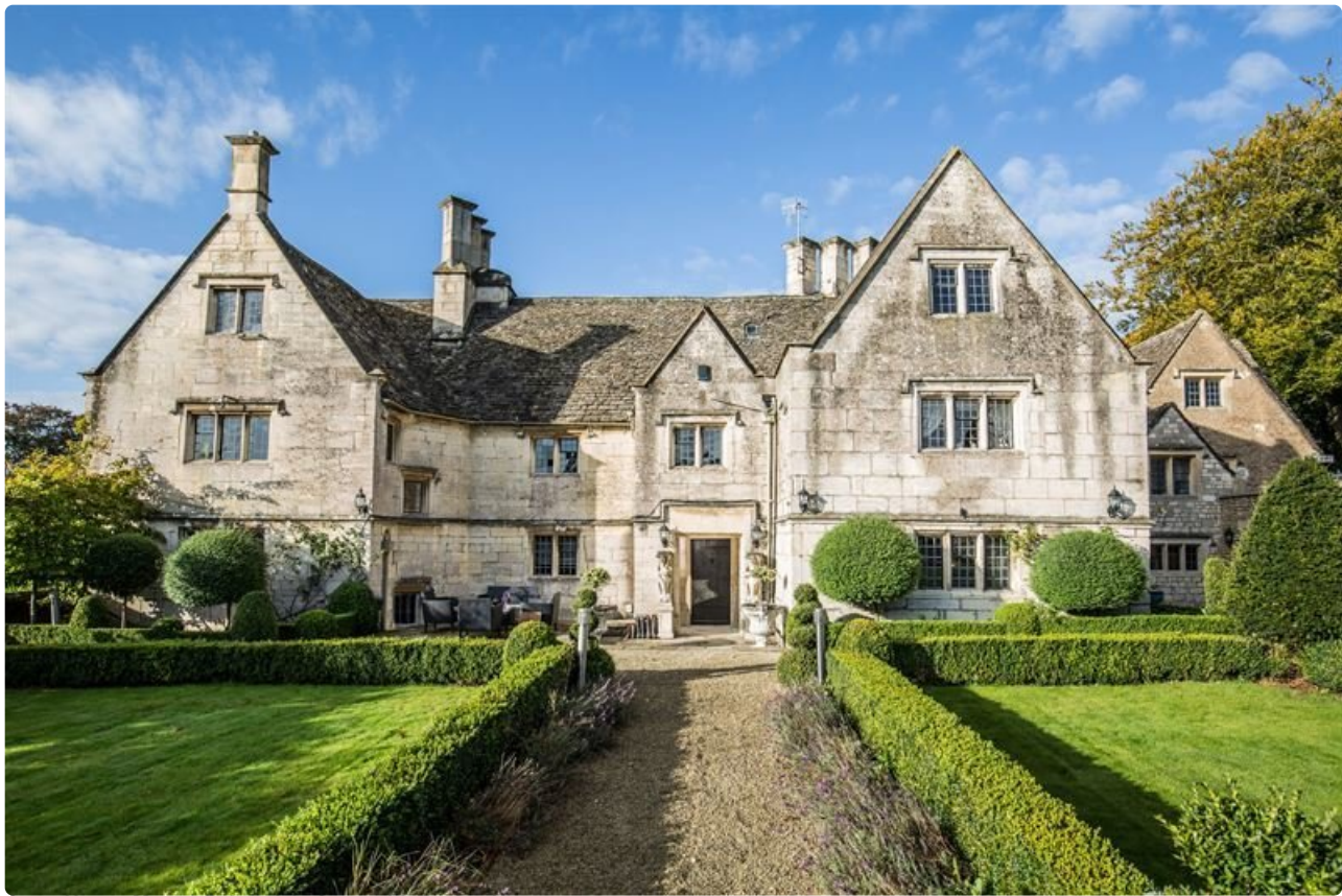
Court House Manor, Painswick, Cotswold, Englanti