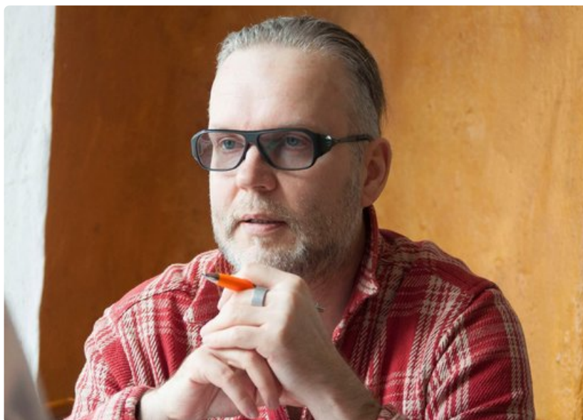
Todellinen Tallinna osa 2 -teoksen on toimittanut Virossa lähes 30 vuotta asunut suomalainen toimittaja, FM Sami Lotila.