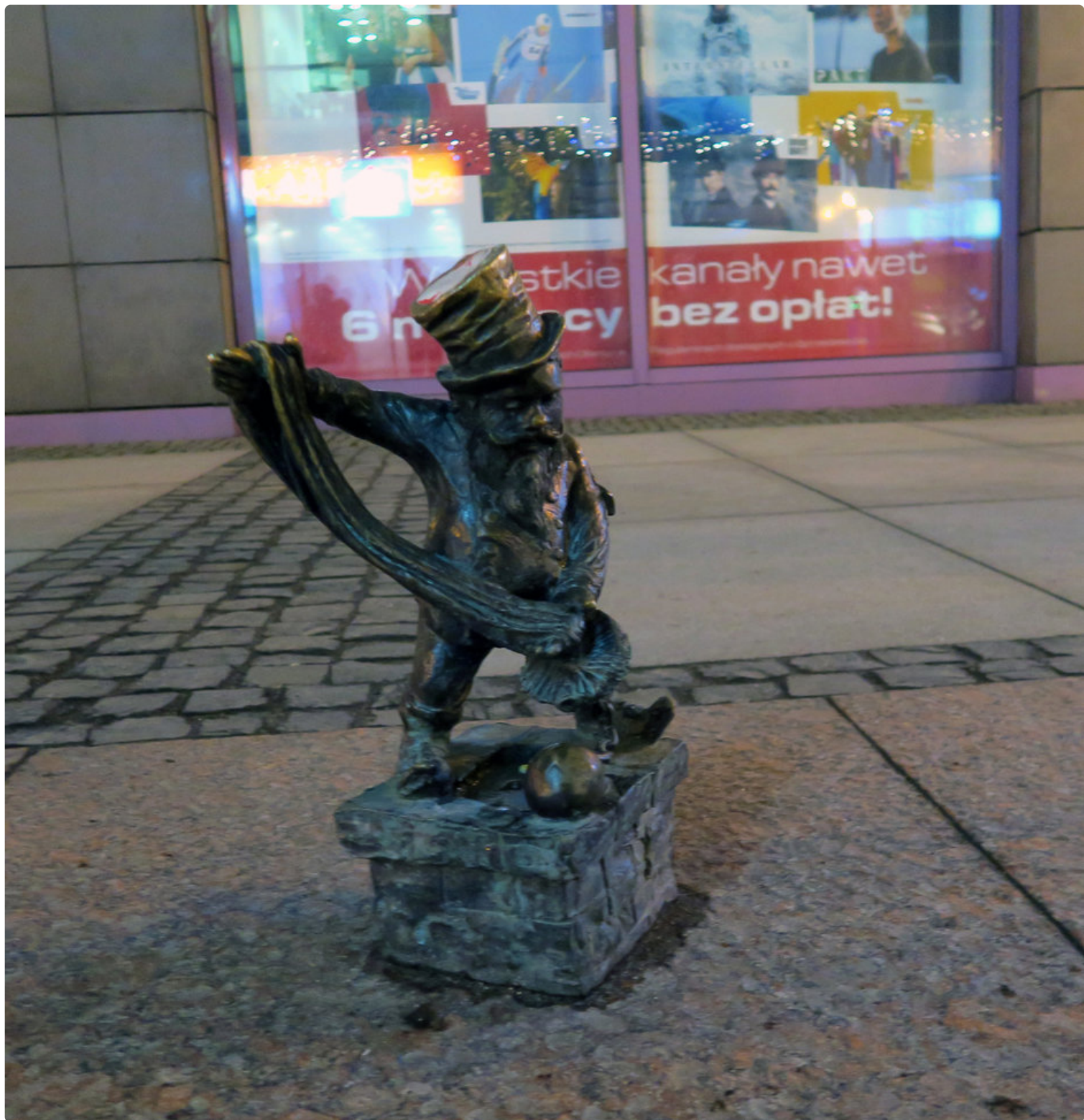
Tontut touhuavat eri puolilla kaupunkia ja eri ammateissa. Tässä nuohoojatonttu.