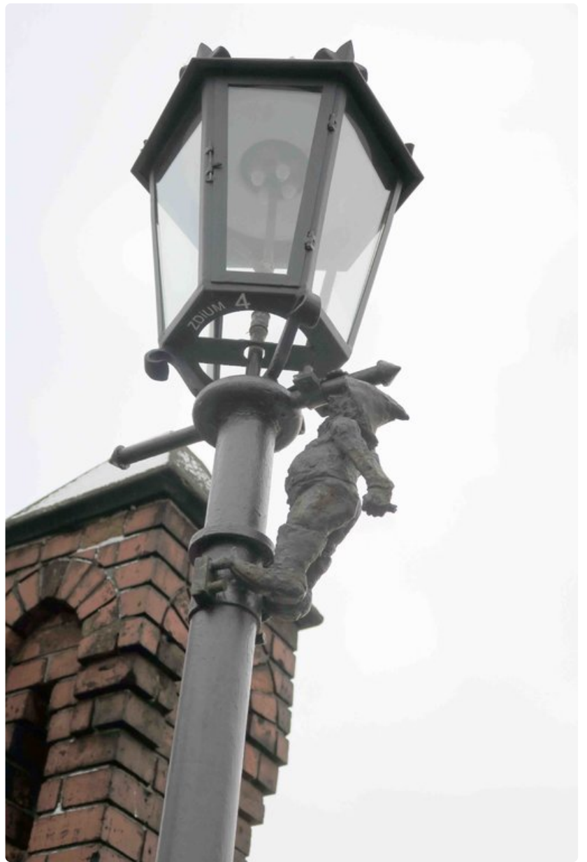
Lyhdynsytyttäjätonttu on kiivenyt pylvään päähän.