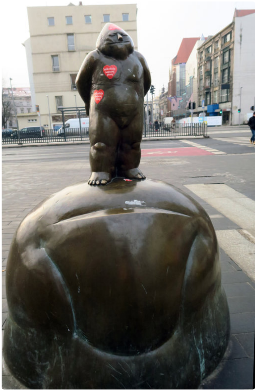
Ensimmäinen, pulleamuotoinen tonttu pystytettiin vuonna 2001 Kulttuuripääkaupunkivuoden infopisteenä toimivan BarBaran viereen.