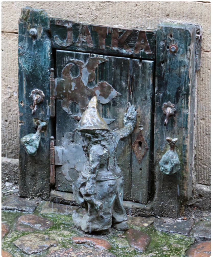
Tonttu ovelle kolkuttaa.