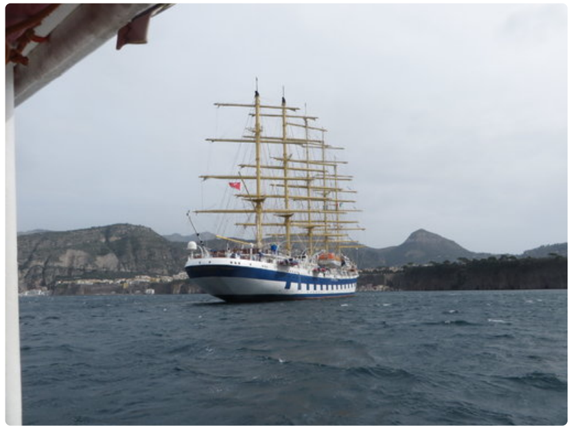
Royal Clipper redillä Sorrenton edustalla.