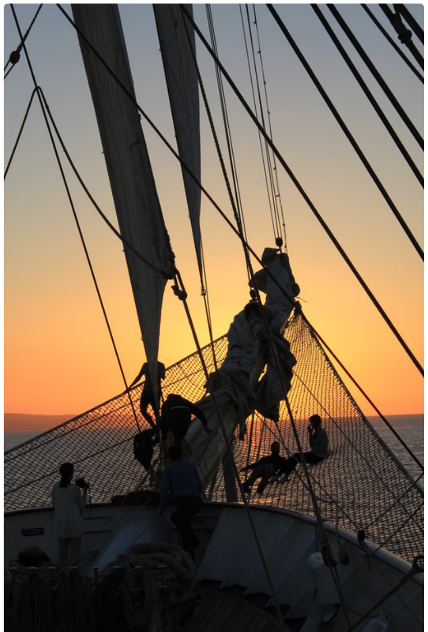
Keulaverkko oli erinomainen paikka nauttia auringon laskusta ja meren kohinasta.

TEKSTI: ESA PAAVOLAINEN