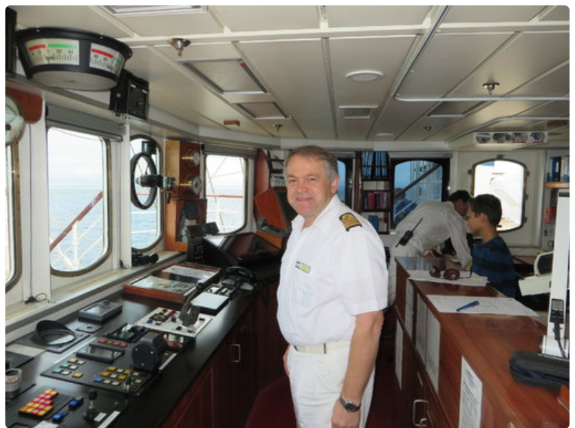
Laivan puolalainen kapteeni komentosillalla.