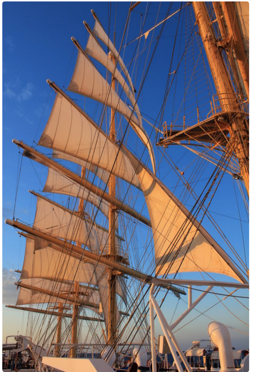
Aamuauringon valossa purjeet näyttivät upeilta.