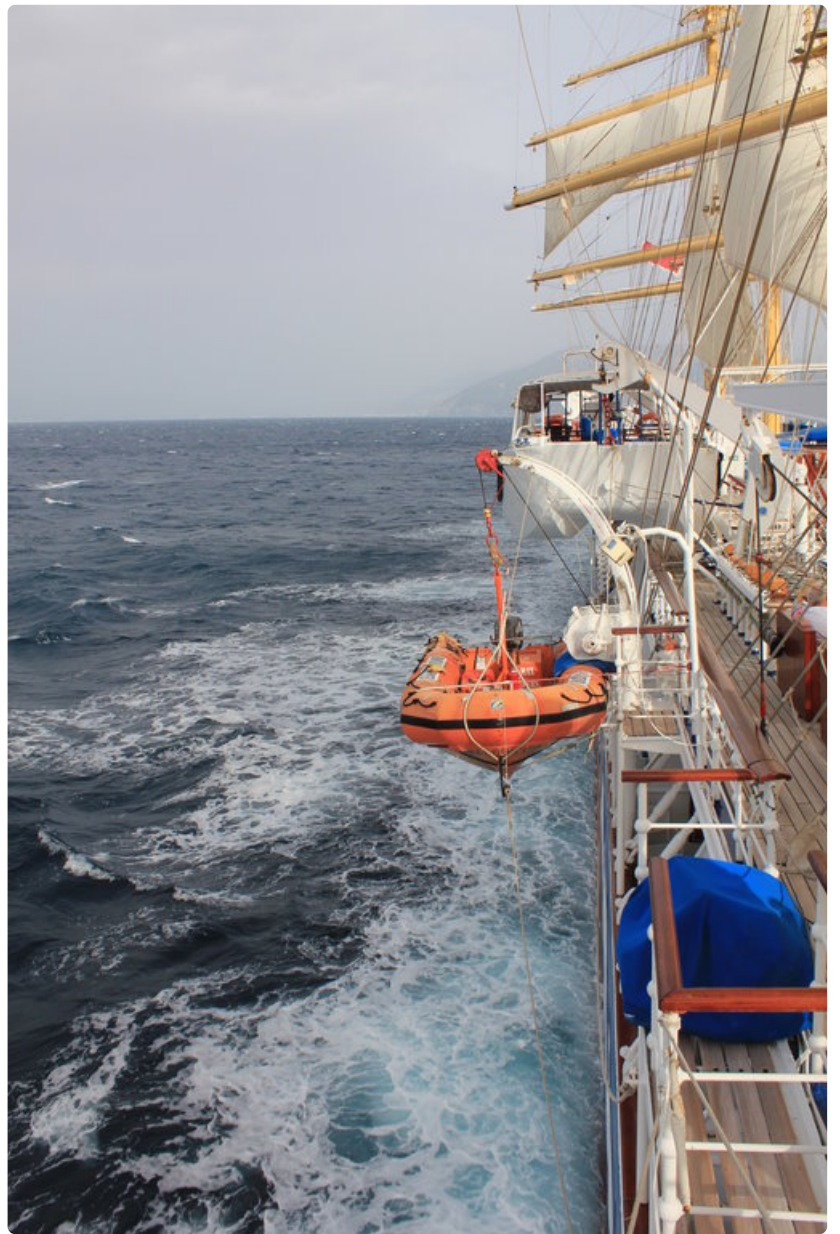
Komentosilta oli hyvä paikka tarkkailla laivan kulkua tuulesa